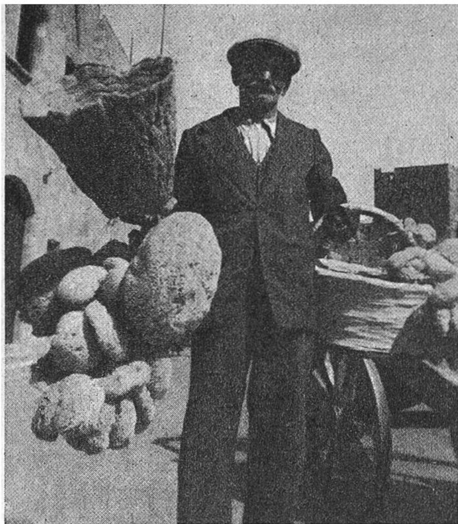
Strassenhändler beleben die Gas- sen. Dieser hier verkauft Schwäm-

me in allen Grössen. Die Schwämme werden von Berufstauchern aus dem Meer heraufgeholt.