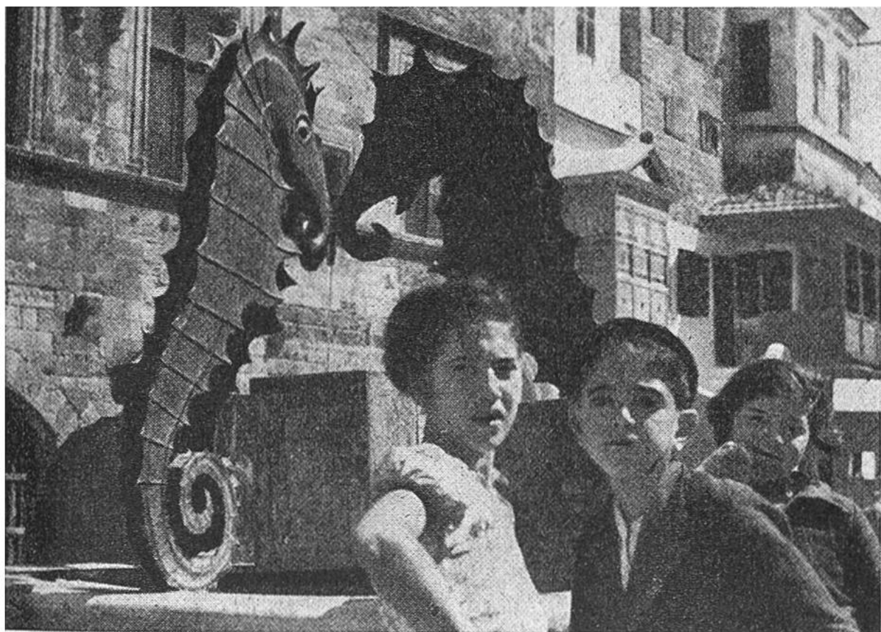
Der prachtvolle Seepferdchenbrunnen in der Türkenstadt spendet kristallklares Wasser, wie es auf den Inseln beinahe überall zu finden ist.

spannt oder, zum Schutze vor Erdbeben, von stützenden Pfeilern eingerahmt. Ziegelbedeckte Dachtraufen springen vor, um die Läden im Erdgeschoss vor der Sonne zu bewahren. Galerien hängen über die Mauern hinaus. Die engen Gassen öffnen sich etwa auf stille Plätze mit zwischen Palmen hochragenden Moscheen. Die ganze Altstadt wird von wuchtigen Mauern und gewaltigen Toren umfassen. Von den Mauern hat man einen wunderbaren Blick auf die Stadt, die Bucht mit den drei Häfen, das blaue Meer und die ferne Küste Kleinasien. Aus dem Dächergewirr ragen zahlreiche schlanke Minarette und die grosse, flache, untertassenförmige Kuppel der Suleiman-Moschee sowie mehrere Kuppeln von byzantinischen Kirchen. Die Moscheen aus der Türkenzeit, 1522–1912, werden noch heute von Gläubigen besucht, während die meisten Türkenbäder nicht mehr in Betrieb sind. Besonders schön sind die im Graben um die Stadt angelegten Gärten. Weiss und rosa blüht, neben Palmen, wildem Fenchel und Pfefferbaum, der Oleander, scharlachrot der Eibisch.