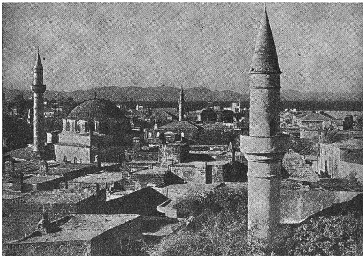
Minarette und Flachdächer beherrschen das Bild der Türkenstadt. Im Hintergrund ist die kleinasiatische Küste sichtbar.

Kleinasien nur etwa 25 km entfernt, ist nicht die älteste Stadt der Insel. Einst gab es deren drei: Lindos, Ialysos und Kameiros. Diese drei Städte gründeten im 5. Jahrhundert vor Christus die Stadt Rhodos als Zentrum der Insel.