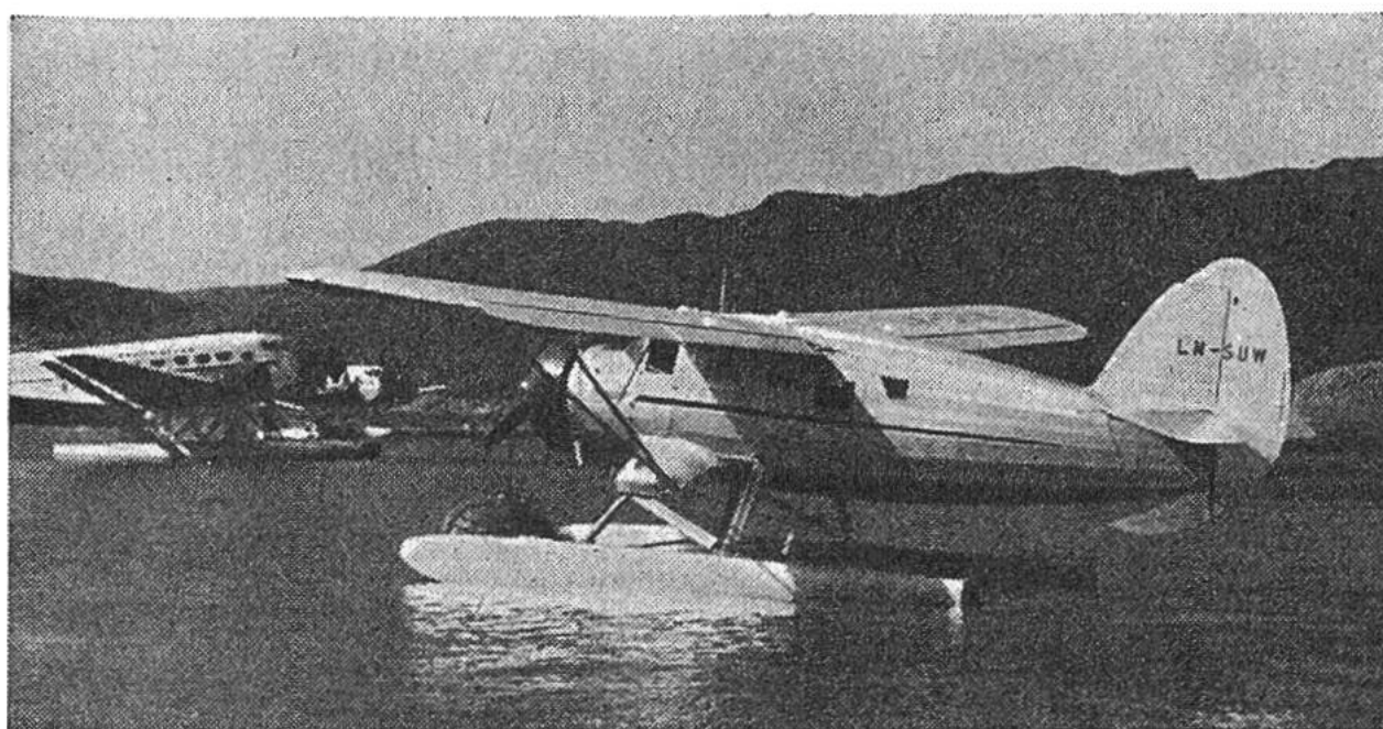
Wasserflugzeuge im Hafen. Links zwei der sehr alten, dreimotorigen Ju 52, im Vordergrund eine amerikanische Maschine.

Fjorde – das Wort aussprechen und an Norwegen denken ist eins. Und doch sind diese meist schmalen, aber tief – Sognefjord z. B. 170 km – in das Land eingreifenden Buchten nicht auf das namengebende Land beschränkt. Wir finden sie nicht nur in Grönland, in Labrador und Britisch Kolumbien, auch die Küsten Südchiles und zum Teil der Südinself Neuseelands sind von ihnen zerspalten.