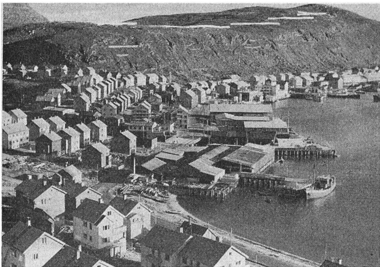
Ein Blick auf Hammerfest, die nördlichste Stadt Europas. Es ist die moderne Siedlung, wie sie nach den Kriegszerstörungen wieder aufgebaut wurde. Deutlich erkennt man den Holzbau der Häuser, die übliche Bauweise in Norwegen.

Weiler oder Einzelhäuser an die Wände. Sie liegen auf Deltas oder flacheren Schuttkegeln, die sich ein Stück in den Fjord vorgelassen haben. Doch nicht weit, denn die Felswände setzen sich auch unter dem Wasserspiegel Hunderte von Metern mit der gleichen Steilheit fort. Ja, die tiefste Stelle im Sognefjord und Lyngenfjord liegt sogar 1240 m unter dem Meeresspiegel. Und das Merkwürdigste – die grösste Tiefe liegt meist im Inneren des Fjordes, d.h. dass der Fjordboden gegen den Ausgang ansteigt. Aber noch haben wir das offene Meer nicht erreicht. Vor uns breitet sich die Inselwelt der Schären aus. Viele dieser unzähligen Inselchen – man spricht von ca. 150000 für Norwegen – ragen wie die Rücken von Walen aus dem Wasser. Für die Küstenschiffe sind sie sehr gefährlich. Diese ziehen für ihre Fahrten die zwischen Schären und Festland gelegenen Sunde vor. Wie aber sind die Fjorde entstanden? Steile Talwände kennen