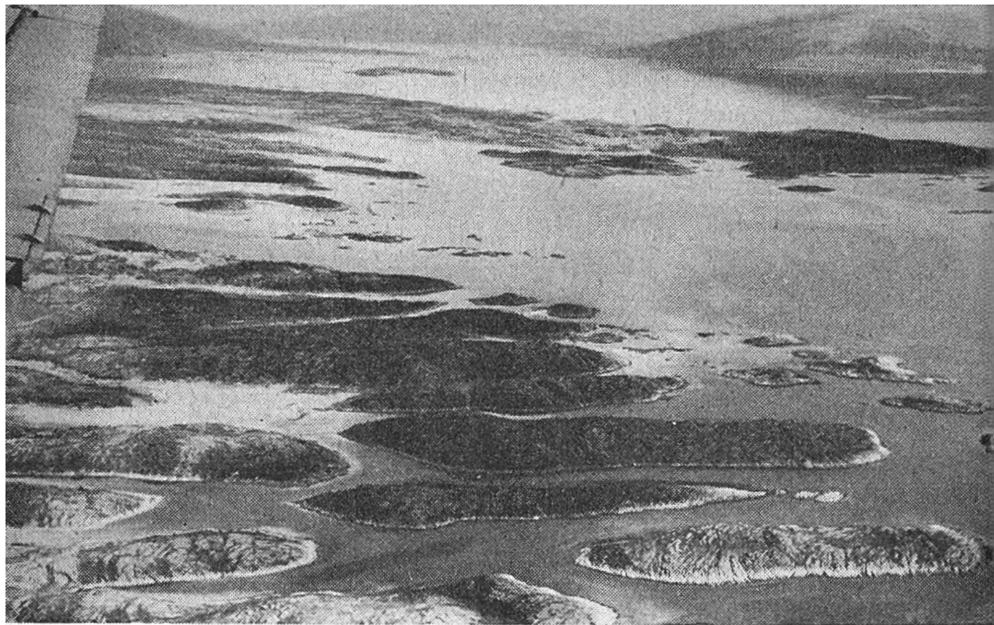
Schärenlandschaft im Westfjord (Nordnorwegen).

Unser Flugzeug hebt sich fast unmerklich vom Wasser ab. Rasch gewinnen wir an Höhe und bemerken mit Staunen, wie die steilen, oft senkrechten Wände, die 1000 m unter uns dem Wasser entsteigen, noch über uns emporragen. Wie gefangen fühlen wir uns, Zwerge in einer Riesenwelt. Würde sich das Flugzeug aus dem engen Schlauch des Fjordes hinaus über die höchsten Höhen erheben, so würden wir in der Tiefe weite wellige Hochflächen erkennen, öde, waldlose Landschaften, welche die Norweger «Fjelle» nennen. Doch wir bleiben im Fjord, bewundern seine erhabene Schönheit, seine Farben mit den Nuancen des Grüns der Wasserflächen, der Wälder und der hochgelegenen Matten. Immer wieder werden sie zerschnitten von silbrigen Fäden oder Bändern, Wasserfällen, die oft Hunderte von Metern hinabstürzen. Selten nur leuchtet das Rot der kleinen Norwegehäuschen zu uns herauf; denn ebenes Land, auf dem man wohnen oder gar Landwirtschaft treiben kann, gibt es wenig. Meist fahren deshalb die Bewohner auf Fischfang aus. Eng drücken sich die