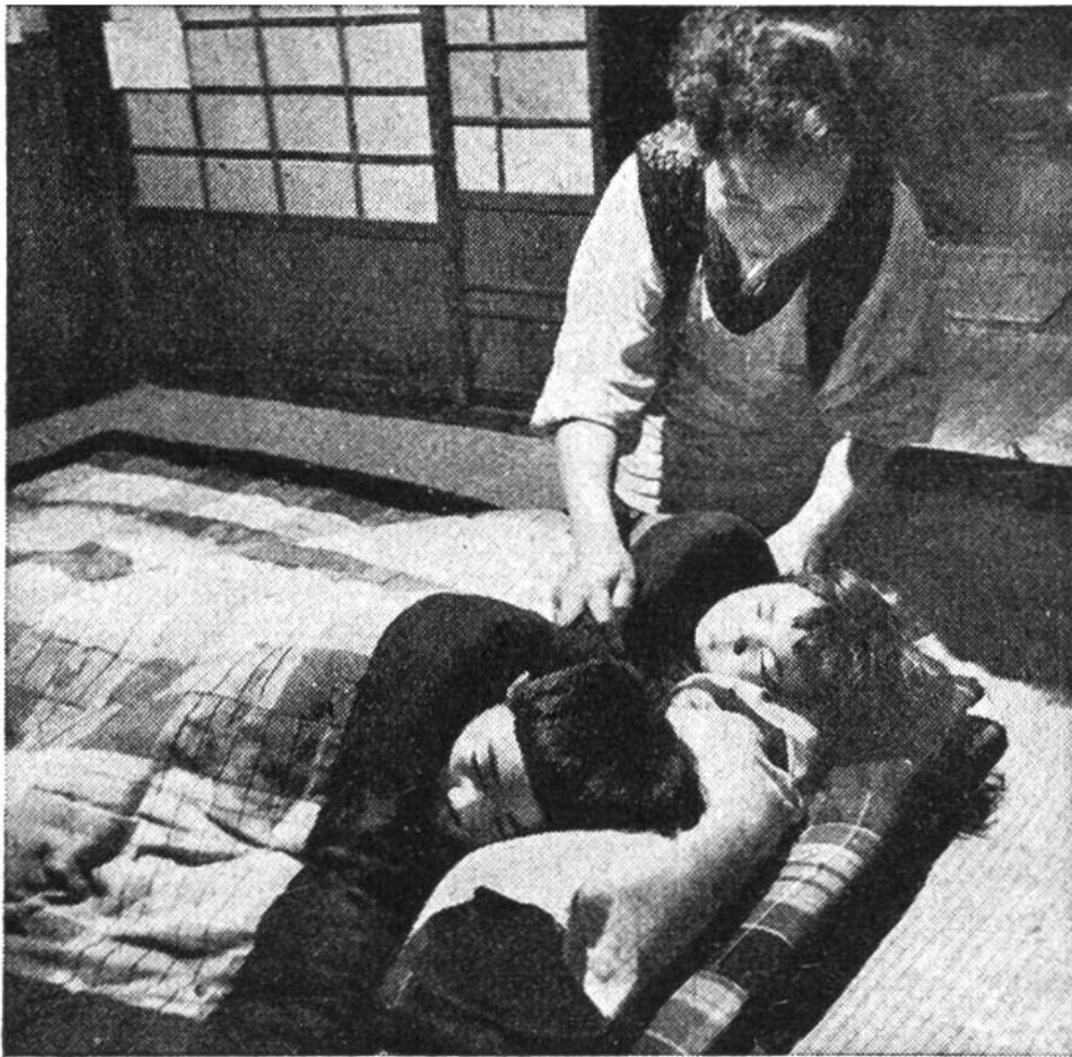
Ohne Bettgestell wird das Nachtlager mittels wattierter Decken auf dem mit dicken Strohmatte (Tatami) belegten Boden hergerichtet.

und die mit Papier bespannten grossen Flächen der Schiebetüren lassen viel Licht ins Innere der Räume – abgesehen davon, dass bei warmem und schönem Wetter diese Türen nach allen Seiten aufgeschoben werden. Die Zimmer haben fast keine Möbel, weil die Japaner auf den gepolsterten Strohmatte (Tatami) sitzen und schlafen. Wir sehen auf dem ersten Bild, wie die Kinder auf den Zimmerboden gebettet werden. Solche Zimmer fangen nicht viel Staub, und das Reinigen derselben ist entsprechend leicht. In Asien gilt Japan als das sauberste Land. Die Strohmatte, die den Zimmerboden voll ausfüllen, sind etwa 7 cm dick und haben ein bestimmtes Mass (etwa 90 \times 180 cm), sodass die Grösse des Zimmers nach der Anzahl der Strohmatte berechnet wird. Diese Strohmatte aber sind eine Brutstätte für Ungeziefer, wie Flöhe und ähnliches; da sie nicht leicht aus der gepressten Lage am Bo-