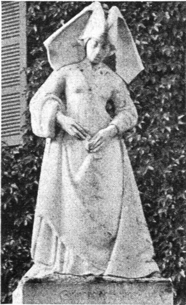
Guigone de Salins, die Gattin des Gründers. Einer ihrer Söhne wurde Kardinal.