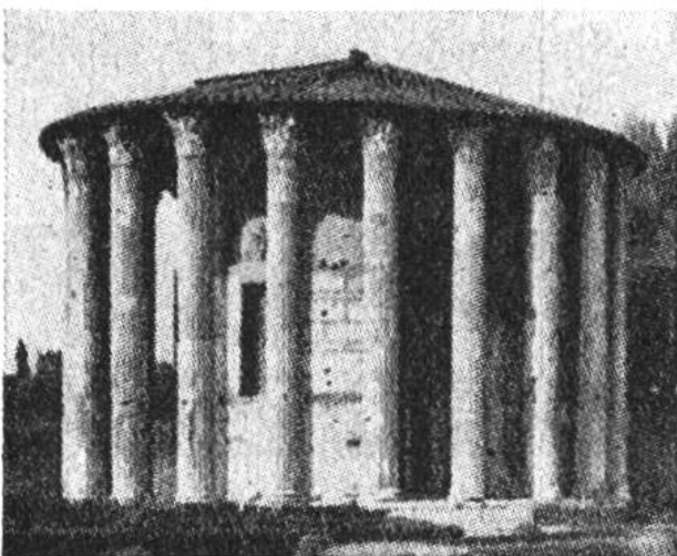
Der kleine Rundtempel (Vespatempel) mit seinen 20 korinthischen Säulen steht auf dem Rindermarkt des alten Rom. 1. Jahrhundert v. Chr.

Als neues Bauglied führten die Römer den Bogen ein. Der Bogen, die Arkadenreihe und die Überwölbung der Innenräume sind die römischen Beiträge an die Weiterentwicklung der abendländischen Baukunst. Nur mit dem Bogen liessen sich bestimmte Bauaufgaben überhaupt lösen. Noch heute bestaunen wir in der Umgebung von Rom und in Südfrankreich die grossartigen, oberirdisch geführten Wasserleitungen, Aquädukte genannt, auf denen den römischen Städten über Täler und weite Strecken hinweg