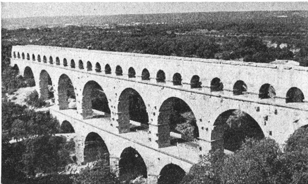
Pont du Gard. Römische Wasserleitung bei Nîmes in Südfrankreich. Erbaut um 15 v. Chr. Die drei Bogenreihen tragen zuoberst den mannshohen Wasserkanal.

das frische Bergwasser zugeführt wurde. Auch in der Auswahl der Baumaterialien gingen die Römer eigene Wege. Sie verwendeten Ziegel- und Bruchsteine sowie, als verbindendes Material, den Mörtel. Die Säule trat stark zurück und diente, beim Kolosseum gut sichtbar, nur als vorgesetztes schmückendes Element. Kennzeichen der römischen Baukunst sind die Raumbeherrschung, die klare Anordnung aller Bauelemente und die diesen Bauten inne-