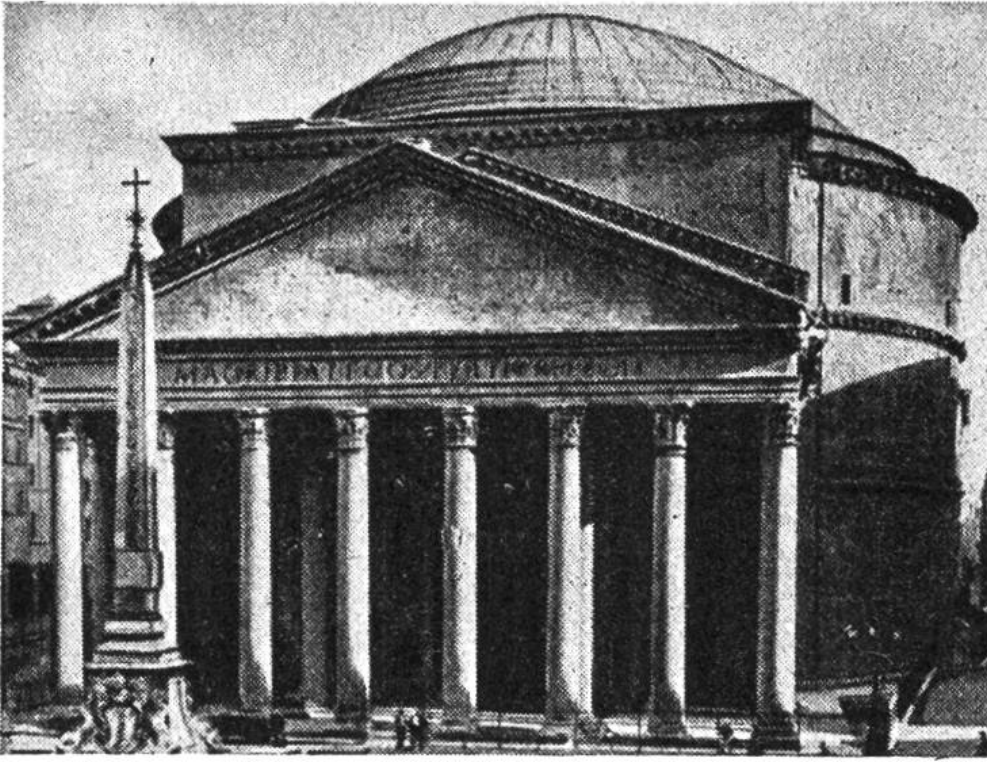
Pantheon, 115–125 n. Chr. in Rom. Abgesehen von dem Säulenvorbau mit 16 Granitsäulen ist das Äussere des Bauwerkes von grosser Schlichtheit.

wohnende Kraft, ein Ausdruck des römischen Machtbewusstseins. In dem einzigartigen Denkmal römischer Baukunst, dem Pantheon in Rom, kommen alle diese Elemente schönsten zum Ausdruck. W.K.