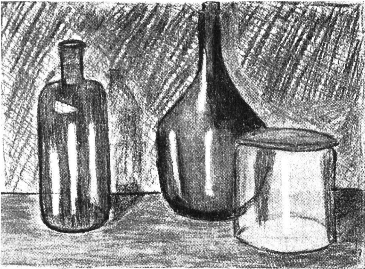
«Stilleben», Farbstiftzeichnung nach Natur von Klaus Sidler (15 Jahre), Fahrwangen.