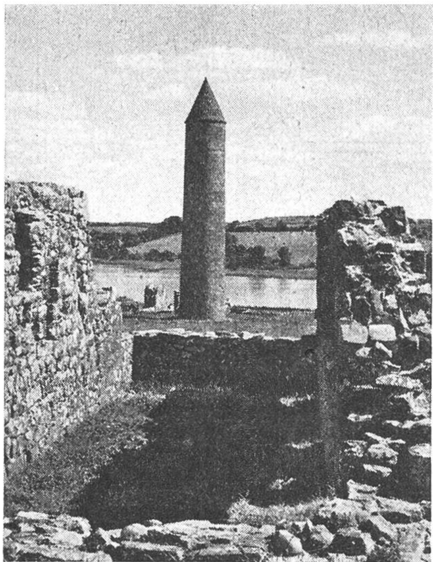
Der Rundturm der zerstörten Devenish Abtei steht auf einer kleinen Insel im Lough Erne, einem flachen Binnensee in Nordirland. Er ist 27 m hoch und noch vollkommen erhalten.