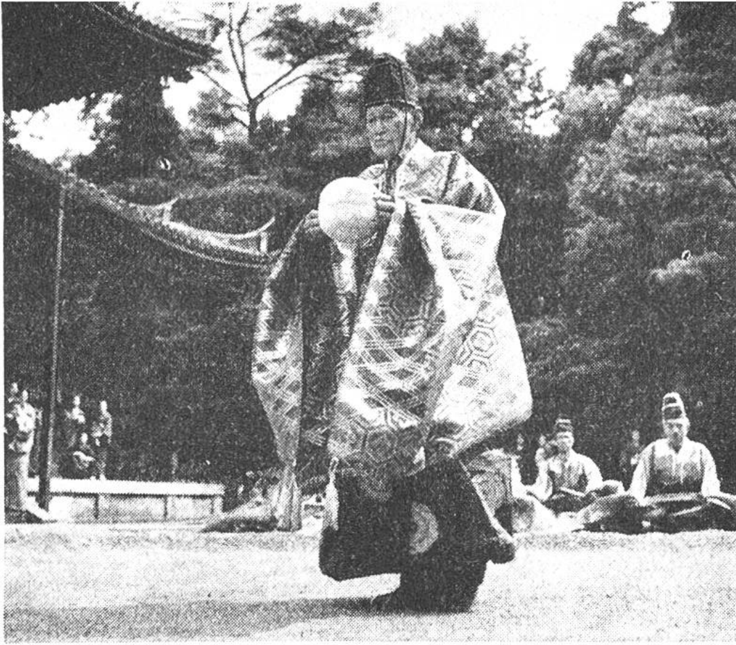
Ein Altmeister beim Eröffnen des Spieles. Im Hintergrund Zuschauer.

Dieses alte Fussballspiel, «Kemari» genannt, war den Aristokraten vorbehalten. Die Kleidung war dementsprechend sehr vornehm und diente mehr der Dekoration als der Zweckmässigkeit. Auch die Kopfbedeckung stellte eher eine Behinderung dar; sie musste mit Bändern unter dem Kinn festgehalten werden. Einzig die Schuhe aus Leder waren einigermaßen sportmässig ausgeführt.