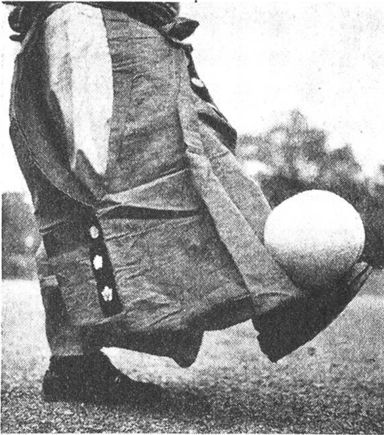
Der Fussball ist aussen mit Wildleder überzogen und hat eine längliche Form, so dass er auf dem Schuh ruhen kann.

Jahre 905 n. Chr. lesen wir, dass bei einem Spiel der Ball 206mal gestossen wurde, ohne die Erde zu berühren. Nach einem andern Bericht aus dem Jahre 953 n. Chr. soll der Ball sogar 520mal hintereinander ohne Berührung mit der Erde geworfen worden sein. Auch Namen von Wettkämpfern sind uns überliefert. Als Teilnehmer zählten normalerweise acht Spieler, doch ist das keine feste Regel. Auf zwei unserer Bilder sehen wir den