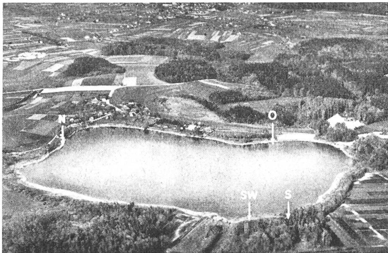
Der Burgäschisee bei Herzogenbuchsee weist vier jungsteinzeitliche Fundstellen auf: Burgäschi-Nord, -Ost, -Südwest und -Süd.