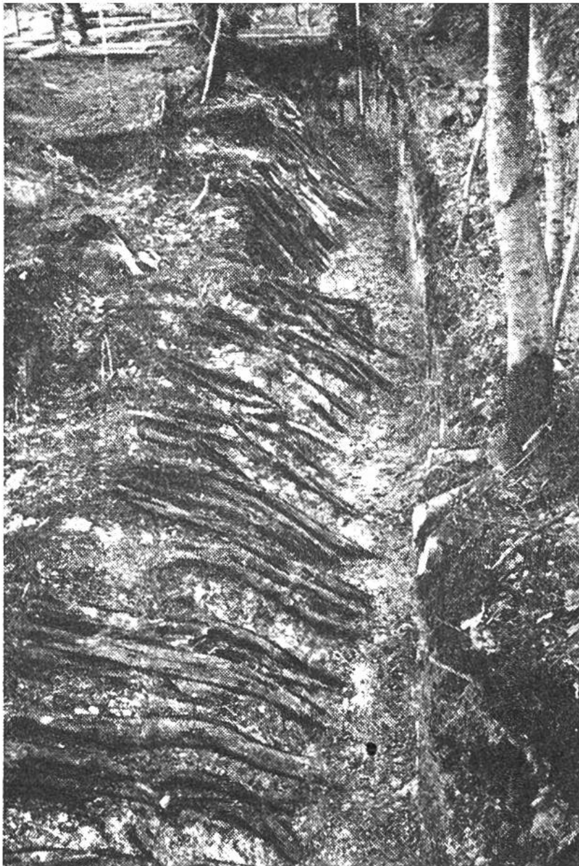
Bei Grabungen des Bernischen Historischen Museums im Jahre 1957 zeigte es sich, dass die Siedlung Burgäschi-Süd von einem palisadenartigen Zaun eingeschlossen war, was die einzigartige Möglichkeit gibt, das Dorf in seiner Gesamtausdehnung zu untersuchen.

sich auf der zu Bern gehörenden Südwestseite; sie wurde 1945 und 1946 ausgegraben. Gleichzeitig stiess man etwas weiter südlich auf eine vierte Siedlung, ohne dass man dieselbe aber damals schon erforschen konnte.