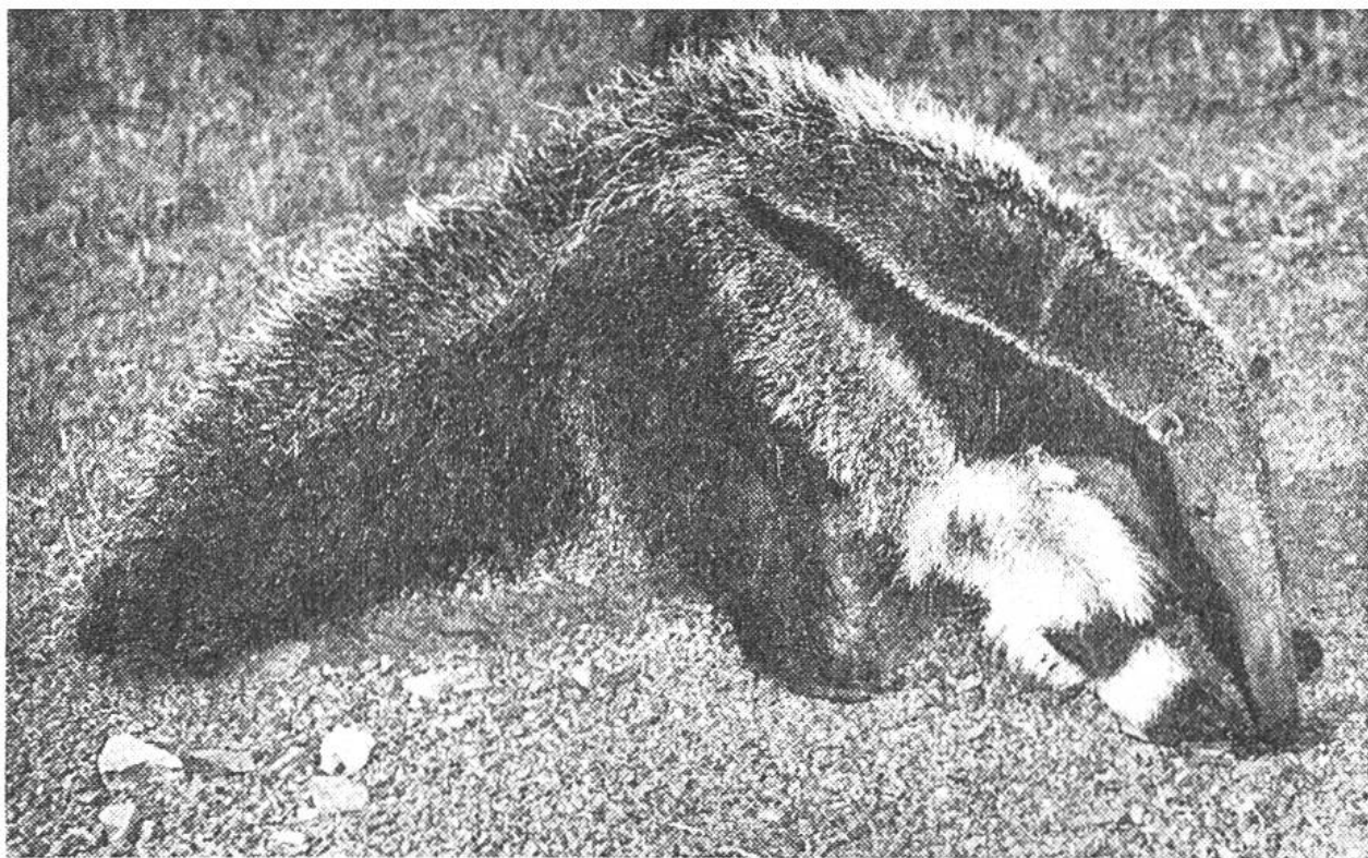
Der südamerikanische Ameisenbär oder Yurumi hat einen ungewöhnlich lang ausgezogenen, röhrenförmigen Schädel.

Neben diesem grossen, mit seinem langhaarigen Fahnenschwanz bis 2 m Länge erreichenden Ameisenbären oder Yurumi gibt es z. B. noch den etwa halb so langen mittleren Ameisenbären oder Tamandua, ferner den nur eichhorngrossen Zwergameisenfresser. In den Tropen haben sich viele Tiere darauf spezialisiert, die unerhörten Mengen von Insekten, besonders die in riesigen Nestbauten zu Hunderttausenden zusammenlebenden Ameisen und Termiten zu verzehren.