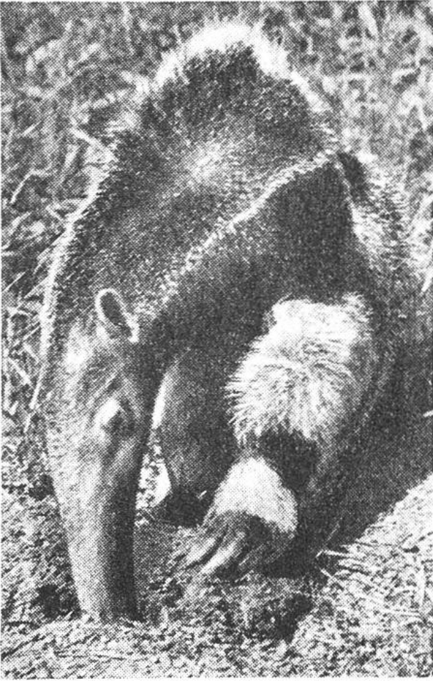
Die kräftigen Krallen und die lange Schnauze sind wichtige Hilfsmittel beim Graben.

gelnde Bewegungen wird die knusprige Beute in der röhrenförmigen Mundhöhle abgestreift und verschluckt. Zahme Ameisenbären werden mit einem Ersatzfutter versorgt, das zur Hauptsache aus gehacktem Fleisch mit Ei und Milch besteht und dem noch allerlei leckere und gesundheitsfördernde Zutaten beigefügt werden. Natürlich kann man dieses Futter einem ganz zahmen Ameisenbären auch einmal am Tisch und in menschlichem Geschirr anbieten, wobei die zuschauenden Tierfreunde wohl den grösseren Spass haben als das Tier selber. H.