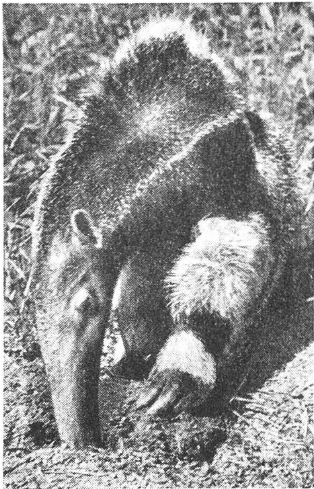
Die kräftigen Krallen und die lange Schnauze sind wichtige Hilfsmittel beim Graben.

gelnde Bewegungen wird die knusprige Beute in der röhrenförmigen Mundhöhle abgestreift und verschluckt. Zahme Ameisenbären werden mit einem Ersatzfutter versorgt, das zur Hauptsache aus gehacktem Fleisch mit Ei und Milch besteht und dem noch allerlei leckere und gesundheitsfördernde Zutaten beigefügt werden. Natürlich kann man dieses Futter einem ganz zahmen Ameisenbären auch einmal am Tisch und in menschlichem Geschirr anbieten, wobei die zuschauenden Tierfreunde wohl den grösseren Spass haben als das Tier selber. H.