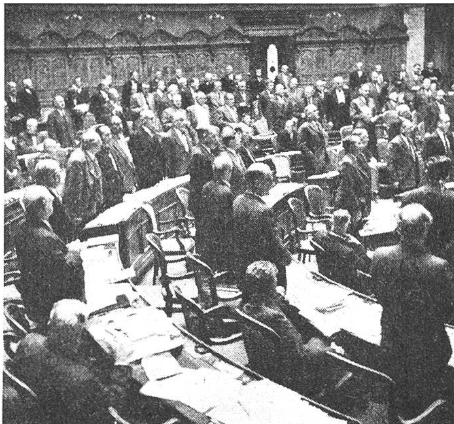
Offene Abstimmung. «Wer dafür ist, bekunde es durch Aufstehen!»

den Bundesrat alle Ratsmitglieder mit Spannung anhören. Abends sind eine Anzahl Nationalräte in einer Gesandtschaft eingeladen, die einen Parlamentarierabend gibt. Es werden Freundschaften geschlossen, die auf den politischen Kampf mildernd einwirken.