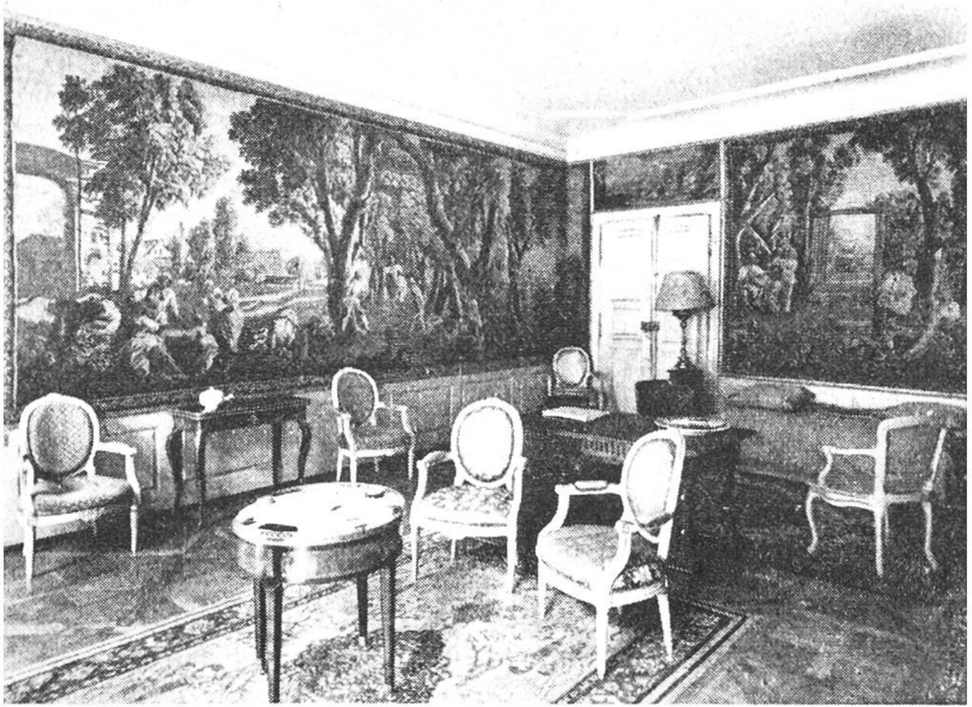
Salon in einem Freiburger Patrizierhause mit französischen Wandbehängen und Mobiliar aus dem 18. Jahrhundert. Stil Louis XV. und XVI.

blauen und roten Farben wiedergegeben, den märchenhaften Reigen. Das Schweizerische Landesmuseum in Zürich und das Historische Museum in Basel zeigen hierzu die schönsten Beispiele. In Frankreich und Flandern entstanden im 15. Jahrhundert zahlreiche Werkstätten, die für die französischen Könige und burgundischen Herzöge tätig waren. Karl der Kühne hatte mehrere Teppiche in den Ateliers von Arras und Tournai bestellt. Dargestellt wurden die ruhmvollen Taten seiner Vorfahren sowie der griechischen und römischen Helden. Zu dieser Gruppe gehört auch Julius Cäsar. Vier Teppiche dieses römischen Feldherrn zierten ehemals den Thronsaal des Burgunderfürsten und gehören heute zu den Kostbarkeiten des Historischen Museums in Bern. Der Ruhm der flämischen Teppiche reichte weit über die Grenzen Burgunds hinaus. Auch ein Bischof von Lausanne bestellte damals für seine Residenz in Ouchy, wo er zu Gericht sass, einen