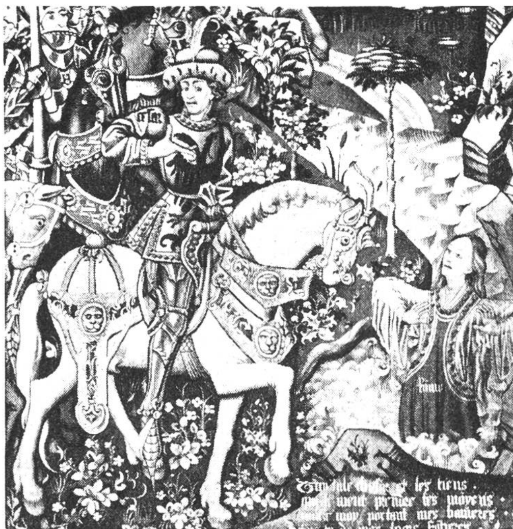
Julius Cäsar wird durch die aus den Fluten des Rubicon emporsteigende personifizierte Stadtgöttin Roms vor dem Bruderkriege gegen Pompejus gewarnt. Ausschnitt aus dem dritten Cäsar-Teppich im Historischen Museum in Bern. Flämische Arbeit aus den Jahren 1460–1470.

Nonnen in Klöstern oder von Hauswirkerinnen im Bürgerhaus angefertigt. In Frankreich und Flandern dagegen hatten Teppiche meist ein Breitenmass von 6–10 m. An einem Teppich arbeiteten zu gleicher Zeit 4–6 Personen. Da ein Wirker in einem Monat nur einen m 2 Fläche zu wirken vermochte, dauerte die Herstellung eines einzigen grossen Teppichs mindestens ein Jahr.