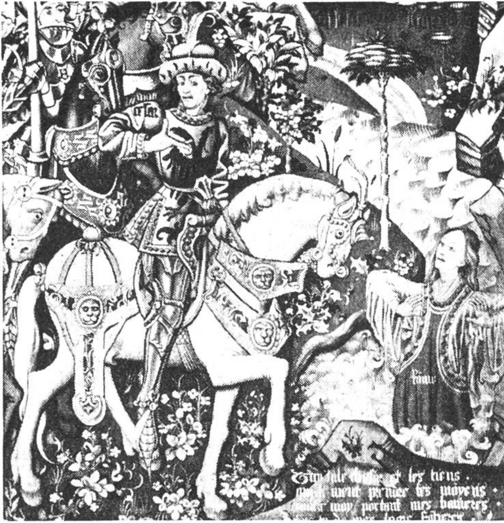
Julius Cäsar wird durch die aus den Fluten des Rubicon emporsteigende personifizierte Stadtgöttin Roms vor dem Bruderkriege gegen Pompejus gewarnt. Ausschnitt aus dem dritten Cäsar-Teppich im Historischen Museum in Bern. Flämische Arbeit aus den Jahren 1460–1470.

Nonnen in Klöstern oder von Hauswirkerinnen im Bürgerhaus angefertigt. In Frankreich und Flandern dagegen hatten Teppiche meist ein Breitenmass von 6–10 m. An einem Teppich arbeiteten zu gleicher Zeit 4–6 Personen. Da ein Wirker in einem Monat nur einen m 2 Fläche zu wirken vermochte, dauerte die Herstellung eines einzigen grossen Teppichs mindestens ein Jahr.