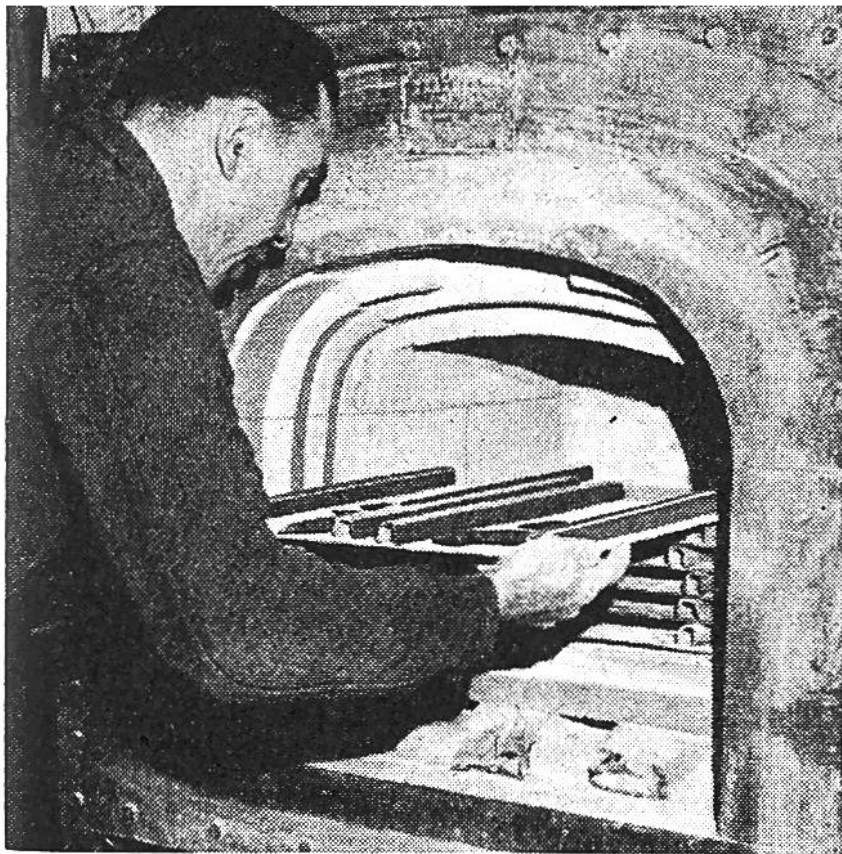
Der Brennofen, der einem Töpferofen gleicht. Hier werden die bemalten Gläser gebrannt.

inhaltlich von der kirchlichen Glasmalerei entfernen. Üppig ausgeschmückte Familienwappen mit figürlichem Zierat, Stadtwappen mit Sinnbildern bleiben zwar noch die Hauptsache; wir finden aber auch Landschaften, Kampfszenen, Historienbilder, die nun auf Glas gemalt als Hausschmuck verwendet werden. Grosse Künstler wie Hans Holbein, Niklaus Manuel und Urs Graf hielten sich nicht für zu gut, zahlreiche Entwürfe zu Glasmalereien anzufertigen. Damit erreichte dieses alte Kunsthandwerk auf dem Gebiet der weltlichen, der profanen Kunst eine Nachblüte in technischer Vollendung und künstlerischer Höhe, die spätere Zeiten nicht erreichen konnten. Ja, sie zeigen einen Verfall der Technik des Glasmalens und ein Schwinden des Sinnes für die Schönheit dieser wohl farbenfreudigsten Kunst.