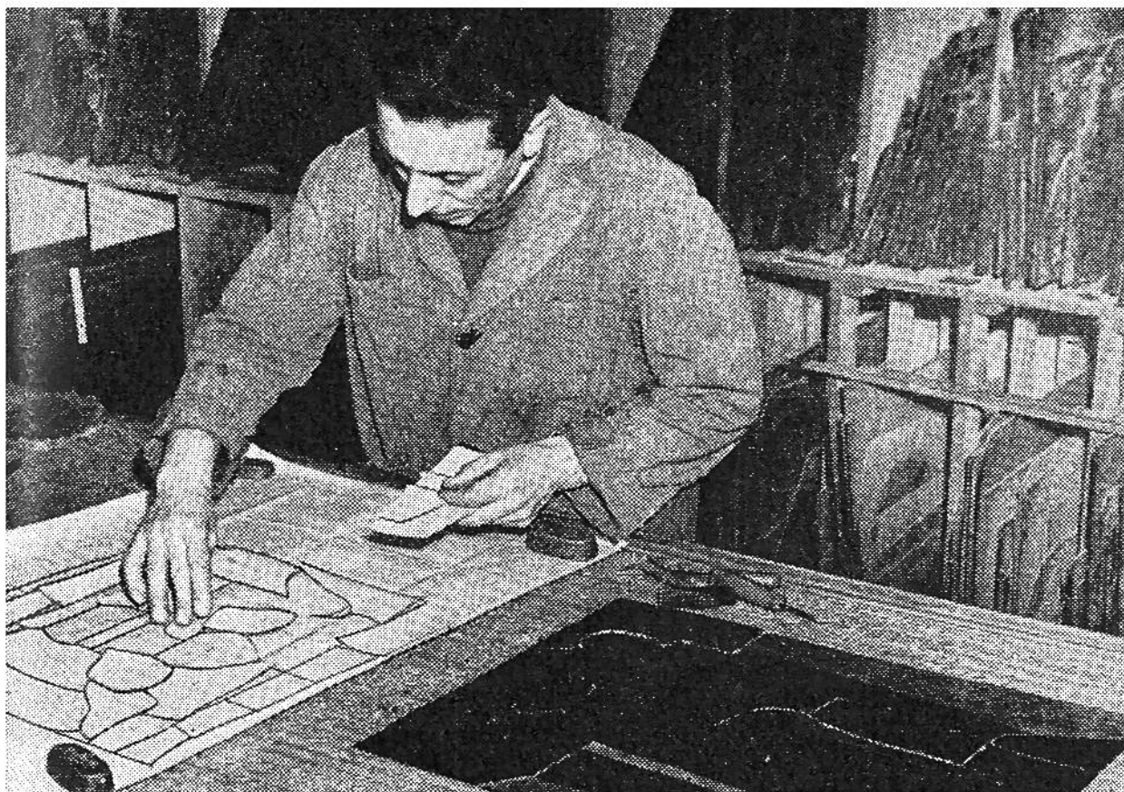
Ein Kunstglaser bei der Arbeit. Einsetzen der Papiermodelle auf der Zeichnung des Entwurfs. Dahinter Gestelle mit 5000 verschiedenen Glasfarbtönen.

reicht. Auch die Schweiz besitzt Kleinodien der Glasmalerei jener Epoche im Berner Münster und in der Kathedrale von Lausanne (die herrlichen Scheiben der Rosette).