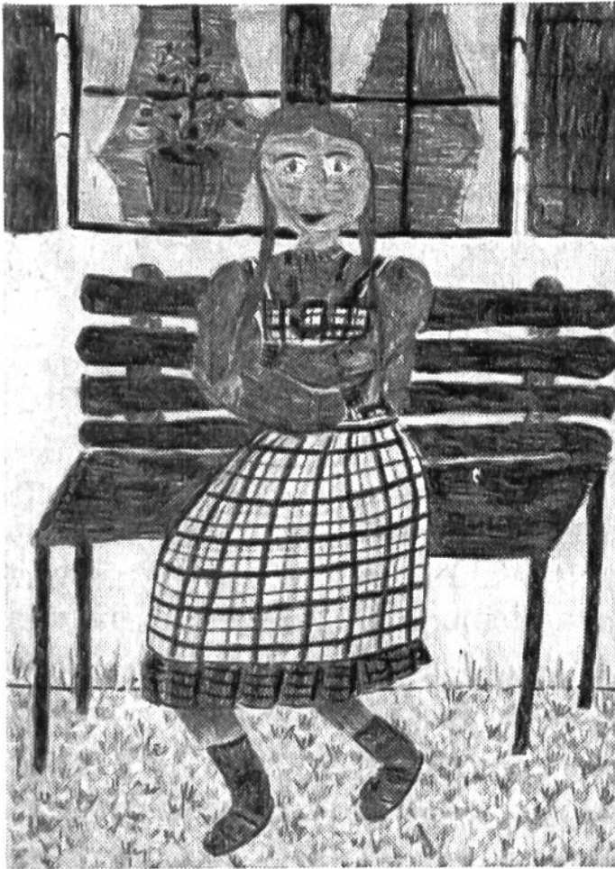
«Sitzendes Mädchen», Farbstiftzeichnung nach Natur von Julia Juon (12 Jahre), St.Gallen.

licher oder erdachter Welt, einen Wunsch, eine Erinnerung, einen tiefen Eindruck oder einen Traum; gerade das zeichnet, was euch einfällt, wozu ihr eben Lust und Freude habt; schreibt auf einem zweiten Blatt einen begleitenden Text dazu. Die Wettbewerbsbedingungen sind auf Seite 154 zu finden; Bestätigung nicht vergessen!