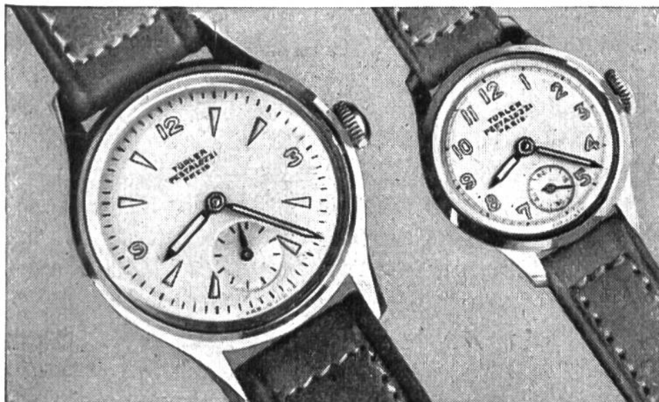
Pestalozzi- Preis- Uhren

Herren- und Damenarm- banduhr (in natürlicher Grösse), aus Nickel- chrom mit Stahlboden, stoss- gesichert, Leucht- zifferblatt.