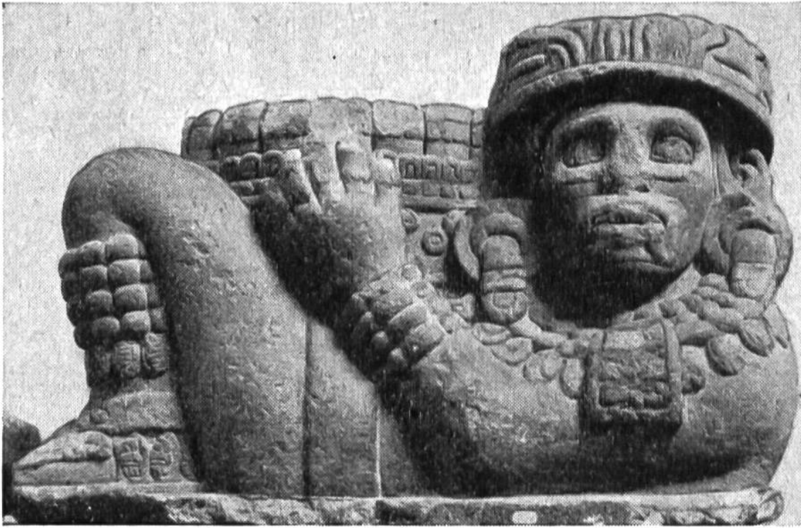
Urnenartiges Gefäß der alten Aztekenkultur.

förmige Schalen selber her. Sie modellieren die Gefäße aus feuchtem Lehm mit den Händen, lassen den Lehm an der Luft erhärten, glätten die Gefäßwände mit einem Schaber und graben dann