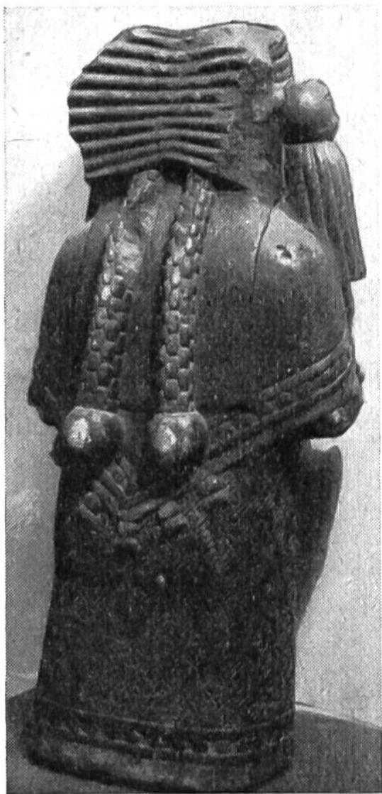
Tonfigur der Aztekenkultur. Besonders schön sind Zopf, Überwurf und Zierformen des Rocks.

zu gestalten. Tier-, Jagd- und Kampfszenen werden in schlichter, aber einprägsamer Weise abgebildet. Es wird sogar versucht, das Bild, das Gesicht und den Körper des Menschen in gebranntem Ton festzuhalten. Als besonders beliebter und häufig wiederholter Zierat erscheinen in der Töpferkunst der Indianer Motive, die von farbigen Teppichen und Geweben übernommen sind. Wir schliessen daraus, dass die Kunst des Webens bei den Indianern noch älter ist als die Töpferei.