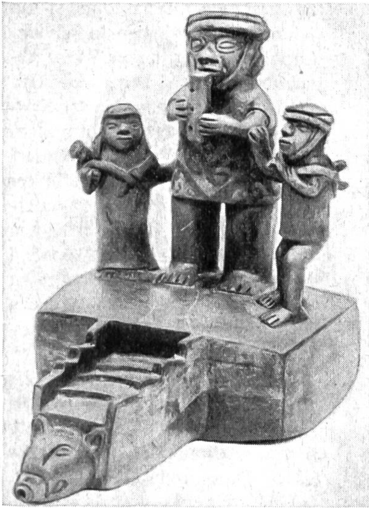
Ein peruanischer Krug – vielleicht ein Vater mit seinen Kindern – wuchtig und eindrucksvoll gruppiert.

men voraus. – Es gibt aber auch bei den Indianern Frauen und Männer, die mit dem primitiven, fast mechanischen Kneten und Modellieren immer gleichförmiger Gefäße nicht zufrieden sind. Sie suchen neue, eigene Formen nach Vorbildern aus der Natur oder eigener Einbildungskraft, verzieren sie mit Figuren, buntem Schmuckwerk und rätselhaften Zeichen und gelangen so zu handwerklichen Schaustücken, die man wohl als kleine Kunstwerke bezeichnen kann. Zum vollen Verständnis dieser gewiss primitiven Kunst muss man mit der Religion, den Sitten und Gebräuchen der Indianer vertraut sein. Gefäße und Figuren werden zuweilen mit geheimnisvollen Zeichnungen und Sinnbildern, mit geometrischen Formen und Linien versehen, die meistens eine symbolische Bedeutung haben. So findet man die Sonne, den Blitz, den Regenbogen, Sonnenblumen oder Kürbisblüten in vereinfachter Form dargestellt. Auch machen die Töpfer der Indianer den Versuch, Erscheinungen des täglichen Lebens künstlerisch