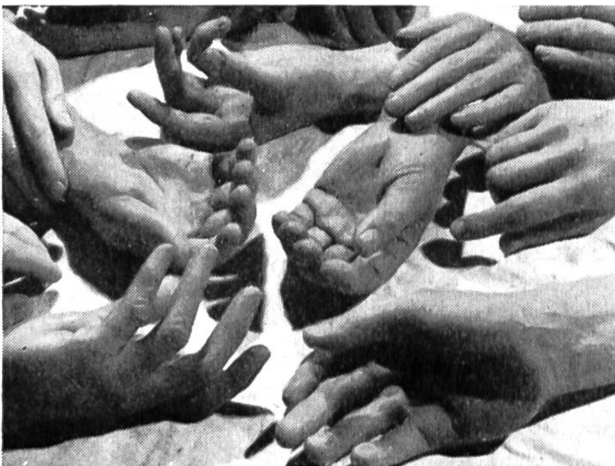
Wachshände, nach lebenden Händen geformt.

Künstlerin, welche die Hingerichteten in Wachs nachbilden musste. Ihr eigener Lebenslauf ist abenteuerlich – und desgleichen derjenige der von ihr erschaffenen berühmten Wachsfiguren.