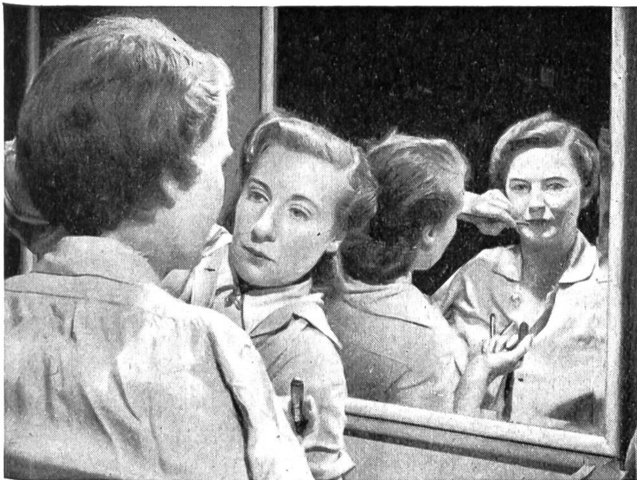
Moderne Sportlerin als Wachspuppe, deren Lippen naturgetreu gefärbt werden.