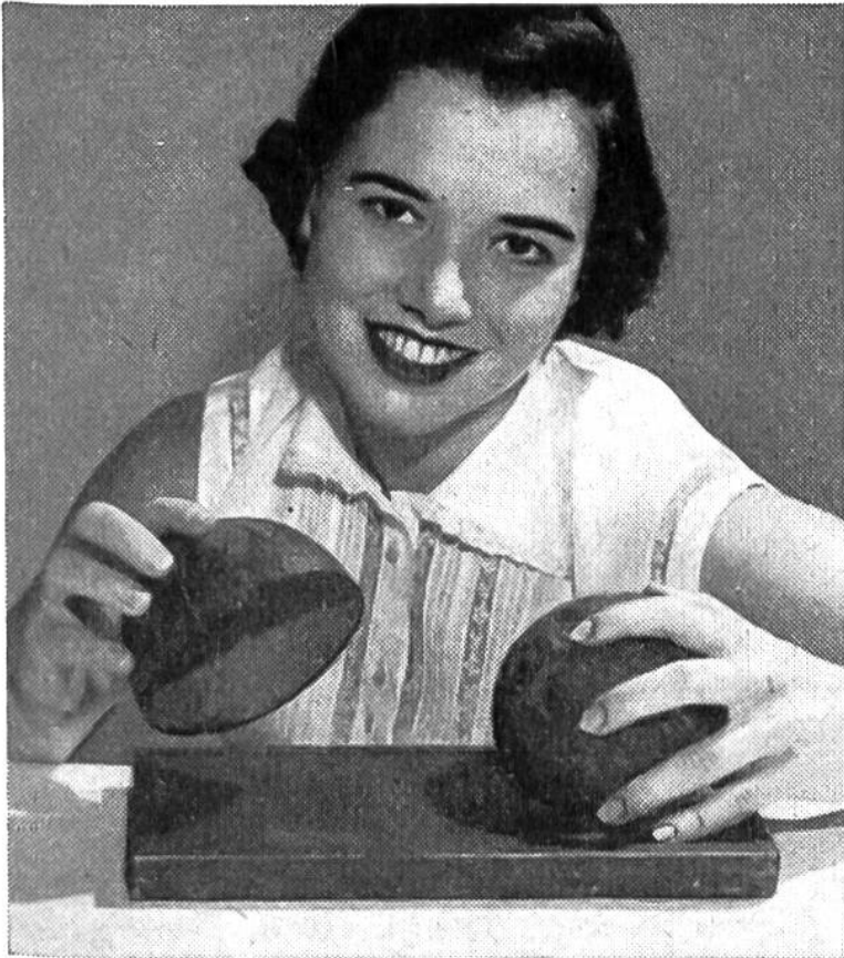
Im Dunkel der Nacht klappern die Hufe über den steinernen Burgweg – in Wahrheit ein täuschendes Spiel mit Geräuschglocken!

das Hundegeheul und -gebell, das Miauen der Katzen und das Piepsen von Vögeln. Was geschieht aber, wenn das Klappern von Hufen auf asphaltierter Strasse, das Schlagen und Ächzen von Türen, das Rollen von Eisenbahnradern, das Rauschen eines Baches verlangt wird? Nicht jedes Geräusch lässt sich durch die menschliche Stimme nachahmen. Entweder werden vor der Sendung gesonderte Geräuschaufnahmen gemacht und während des Spiels mechanisch