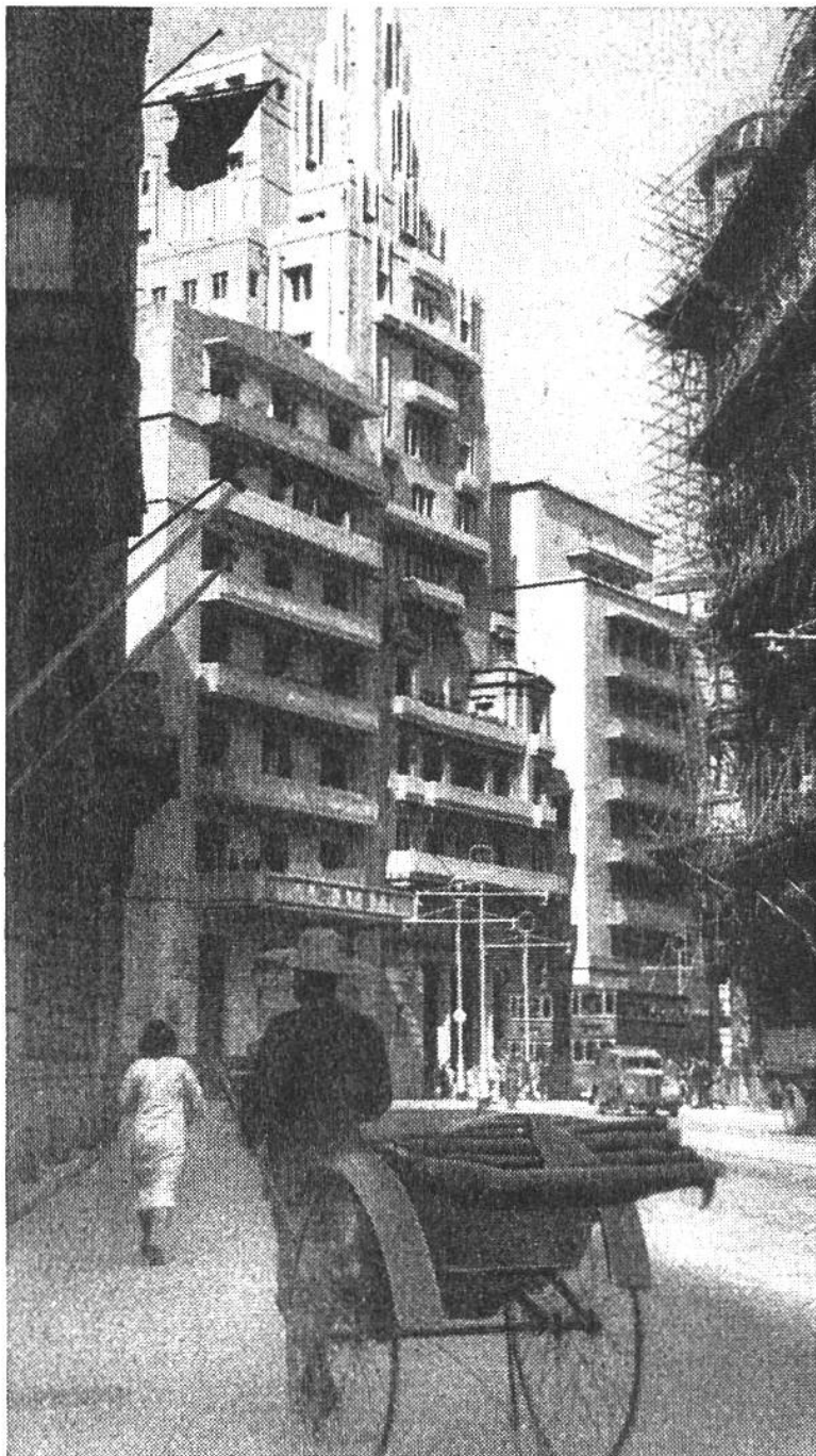
Großstädtische Hochhäuser in Hongkongs Hauptstadt Victoria. Im Vordergrund ein chinesischer Kuli mit Rikscha.

ländern gegründet worden ist. Das Wichtigste an Hongkong aber ist der vorzügliche Hafen, geschützt und geräumig genug, dass in ihm Welthandel grossen Stils getrieben werden kann.