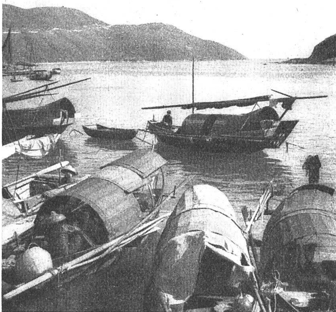
Fischer- und Wohnbarken der Chinesen in einer Hafenbucht.

ter dem Schutze englischer Kriegsschiffe zu einem Handelszentrum von Weltbedeutung. Als wichtigster Zwischenhafen Ostasiens hat Hongkong eine beherrschende Stellung auch im Aussenhandel Chinas erobert. Mehr als 50 000 Seefahrzeuge aus aller Welt legen alljährlich an den Landungsbrücken des Hafens an, löschen und laden und haben einen Reichtum auf die Insel gebracht, der ausser den Europäern einer überaus geschäftstüchtigen, wenn auch kleinen Oberschicht chinesischer Kaufleute zugute kam. In Hongkong reichen sich Ost und West die Hand. Reis, Rohrzucker, Baumwolle werden ausgeführt; Schiffbauwerften, Banken, Zucker-, Zement-, Glas-, Seifen- und Tabakfabriken sowie unzählige Handelsniederlassungen sind entstanden. Die Hauptstadt besitzt Schulen, Universität und Rundfunksender. Aber der beispiellos rasche Aufstieg der Kronkolonie musste