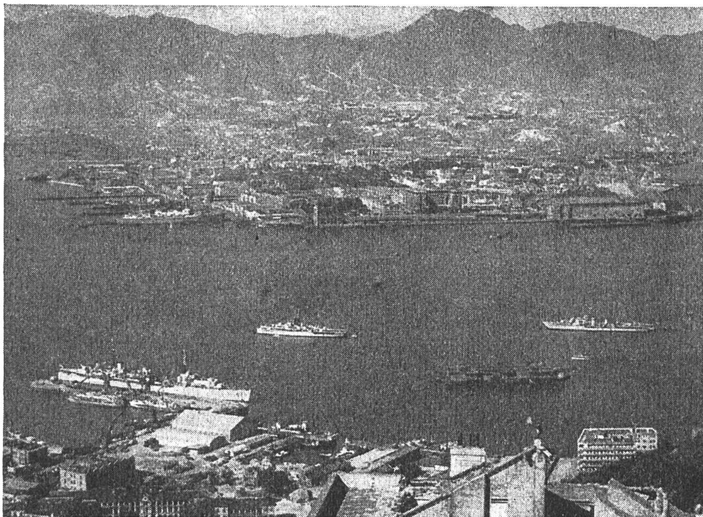
Blick von der Insel Hongkong über Hafen und Meerenge nach der Halbinsel Kaulun auf dem chinesischen Festland.