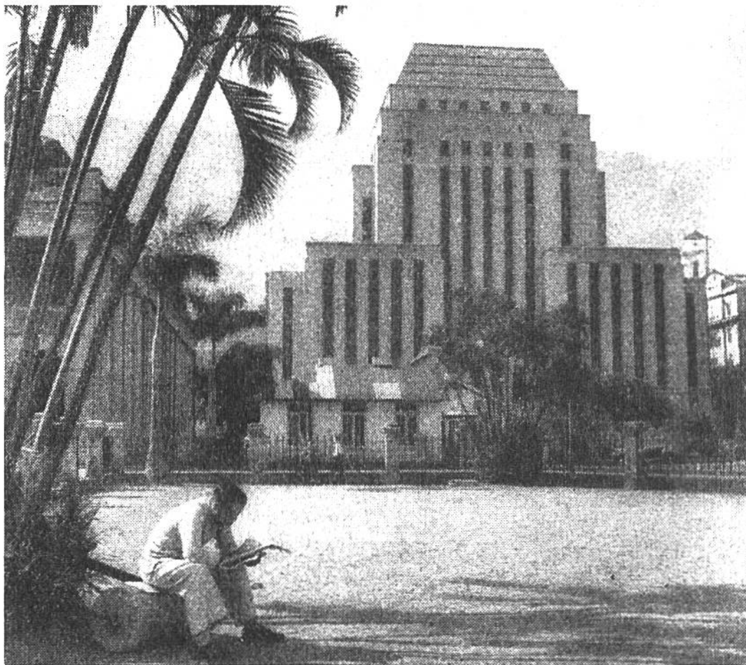
Der Sitz der Hongkong-Shanghai-Bank in Victoria. Der gewaltige Austausch an Gütern und Geld bedarf einer weltstädtischen Verwaltung.

von Anfang an mit grossen Sorgen und Opfern auf englischer wie auf chinesischer Seite bezahlt werden. Fast zwei Millionen fleissiger Chinesen leben innerhalb des Territoriums als Fischer und Arbeiter in ärmlichen, kulturlosen Verhältnissen. Ungefähr 100 000 Menschen wohnen in kleinen Wohnbooten auf dem Wasser. Nur wenige sind zu Wohlstand gelangt. Das ist vielleicht zu verstehen, wenn man bedenkt, dass die wirtschaftliche Lage der Chinesen im Binnenland eher noch schlechter ist.