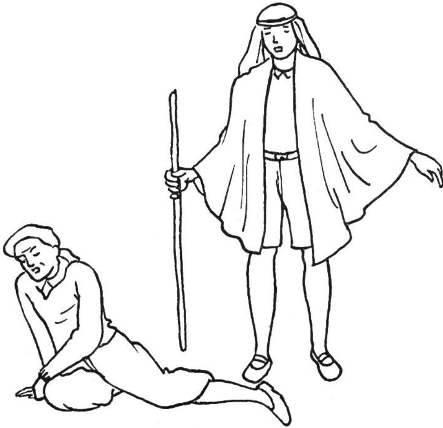
Der verlorene Sohn.

nen) Zuschauermenge eine Rede zum 1. August! Scheltet als Lehrer einen nachlässigen Schüler aus; mimt ein Telefongespräch, wobei ihr am Apparat eine gute oder eine schlechte Nachricht erfahret!