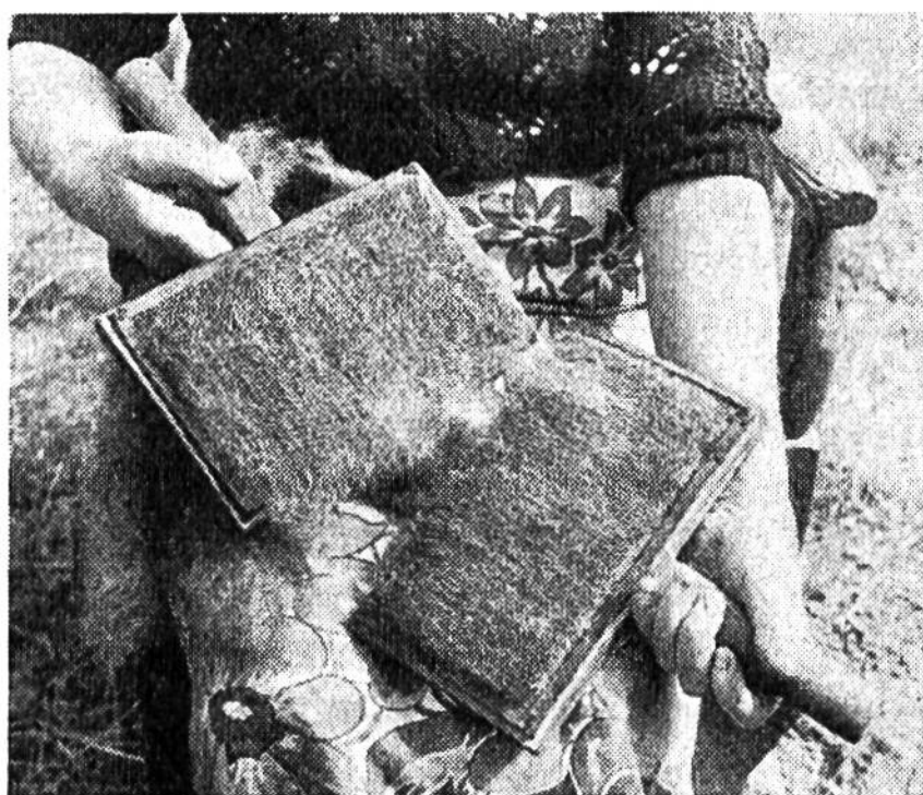
Wollbearbeitung mit der Karde vor dem Verspinnen.

schaft rauh genug zu sein scheinen, kennt dieses nördlich gelegene Land ein ozeanisch mildes Klima mit allerdings sehr häufigen Regen- und Nebeltagen, aber verhältnismässig wenig Schneefällen. Die Temperaturen sinken selten tiefer