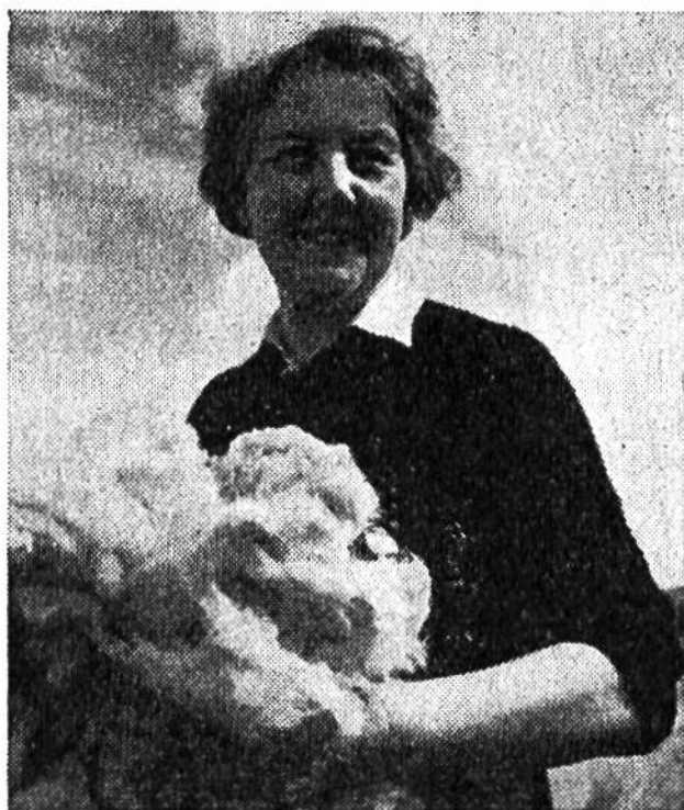
Vollstolz zeigt diese schottische Bäuerin den Wollertrag eines Schafes.

Millionen Schafe, wobei heute die grössten Wolllieferanten auf der südlichen Halbkugel zu finden sind. Auf den britischen Inseln steht die Schafzucht seit Jahrhunderten in Blüte. Unsere Bilder zeigen, wie auf der Skye-Insel der schottischen Hybriden noch nach alter Väter Sitte Schafwolle zu solidem Wollgewebe verarbeitet wird. Obwohl die baumarmen Weideflächen und die düsteren Moore der zum schottischen Hochland gehörenden Bergland-