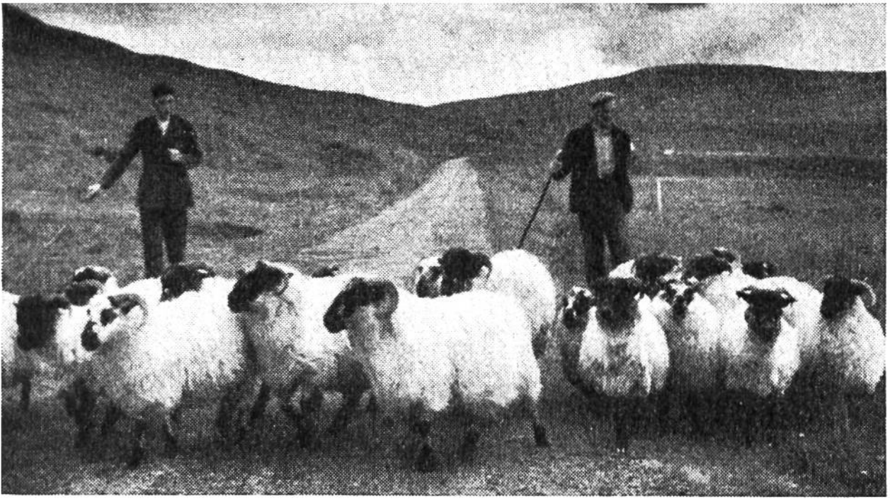
In Tweed gekleidet, treiben zwei Hirten ihre Schafe auf die schottische Heide hinaus.