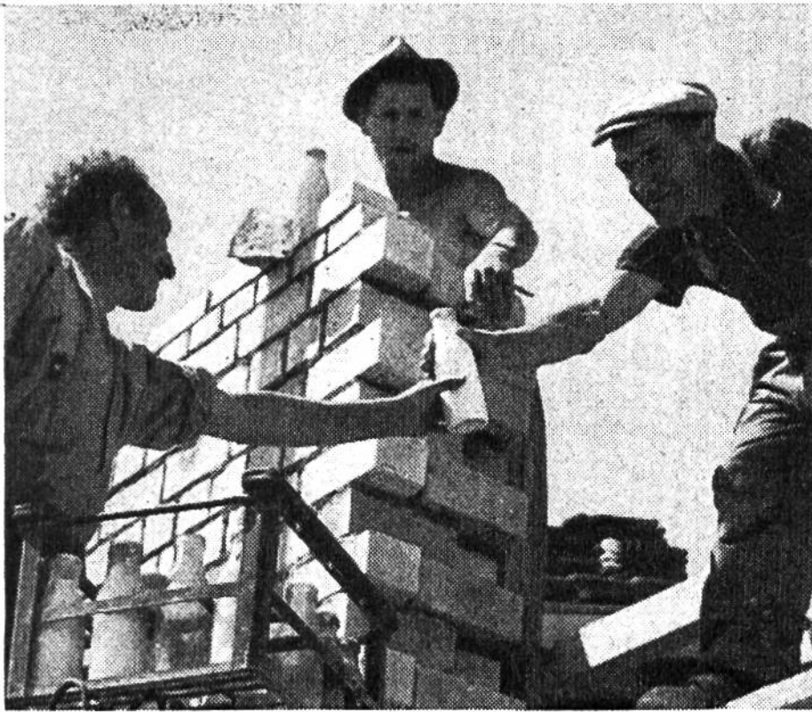
Pasteurisierte (entkeimte) Fla- schenmilch auf dem Bauplatz.

Begriff der Kalorie (Masseinheit für die Wärmemenge) eingeführt und die verschiedenen Nährstoffgruppen in Kalorien umgerechnet. Ein erwachsener Mann braucht im Tag Nahrung von etwa 2400 Kalorien Nährwert, ein Schwerarbeiter