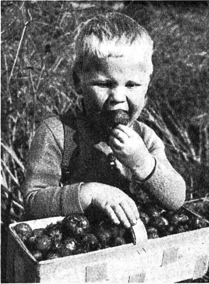
Wie herrlich schmecken frisch- gepflückte Erdbeeren!

sten nach körperlichen Anstrengungen, ein. Wer sich an möglichst geregelte Mahlzeiten hält, ohne zwischenhi- nein etwas zu sich zu nehmen, leistet seiner Gesundheit die besten Dienste. Junge Menschen, die noch wachsen, essen von selbst so viel, dass sie ihren Körper nicht nur erhalten, sondern ihm darüber hinaus noch Baustoffe für das Weiterwachsen und für die Leistung vollwertiger Arbeit in Schule und Berufslehre zuführen.