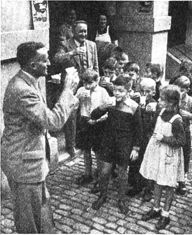
Zum Wohl! – Süssmostaktion in einer Stadtschule.

oft sogar das Doppelte. Solche Zahlen sind vor allem in Notzeiten wichtig, wo es um die Sicherung der Landesversorgung geht. So haben die Eidg. Ernährungskommission und das Kriegsernährungsamt im vergangenen Krieg in den monatlichen Rationierungsmarken stets möglichst vielseitige Nahrungsmittelzuteilungen von über 2000 Kalorien pro Tag gewährleistet. Kartoffeln, Obst und Gemüse, diese wichtigen Nährstoffspender aus eigenem Boden, waren zudem stets nach Bedarf erhältlich.