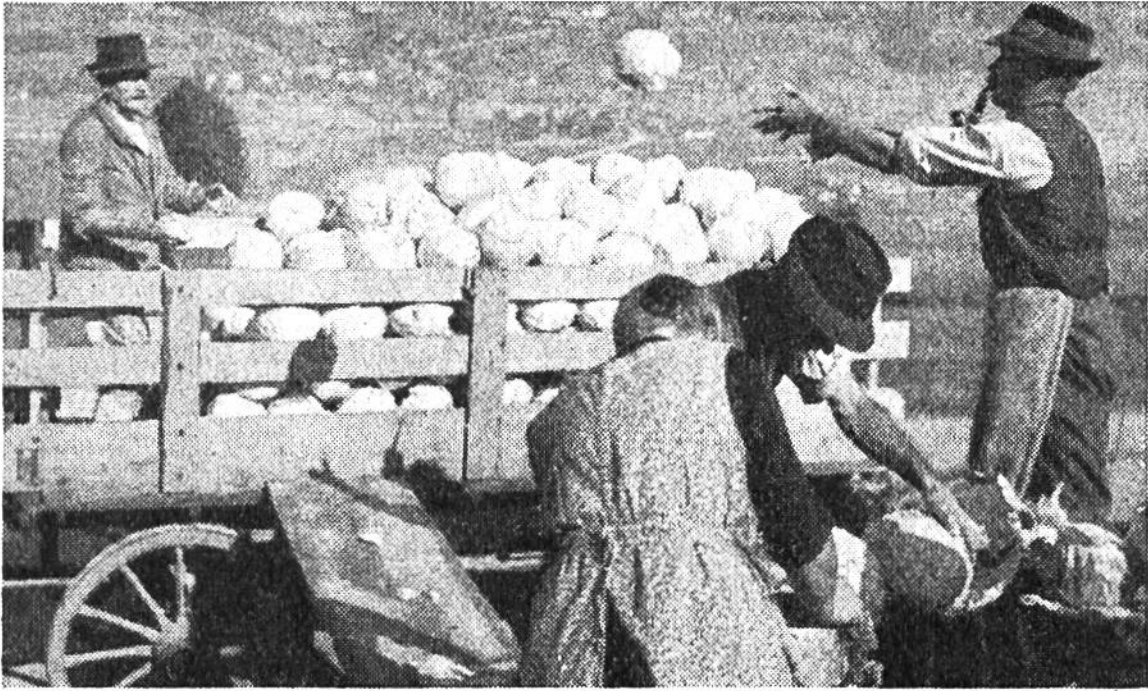
Ernte von Einschneidekabis, aus dem gesundes Sauerkraut zubereitet wird.

gegangen, was nicht im Interesse der Volksgesundheit ist; denn richtig zubereitete Gemüsespeisen und Salate führen dem Körper eine Menge unentbehrlicher Mineralsalze und Vitamine zu. Gemüse sollen normal gedüngt, also nicht einseitig getrieben oder nur ungenügend mit Pflanzennährstoffen versorgt werden.