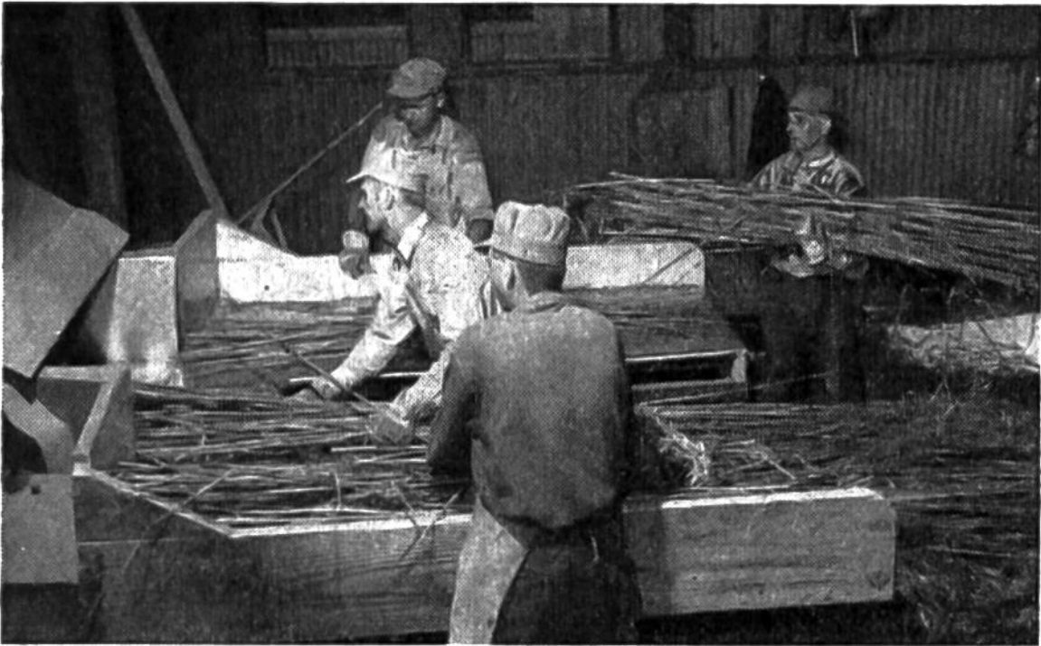
Maschinelles Brechen des Hanfs.

Familie der Maulbeergewächse. Als zweihäusige Pflanze entwickelt er männliche („Fimmel“) und weibliche Stengel („Mäschel“). Der Hanf gedeiht vorwiegend in der wärmeren Zone. Dank der kurzen Wachstumszeit von nur 90–105 Tagen