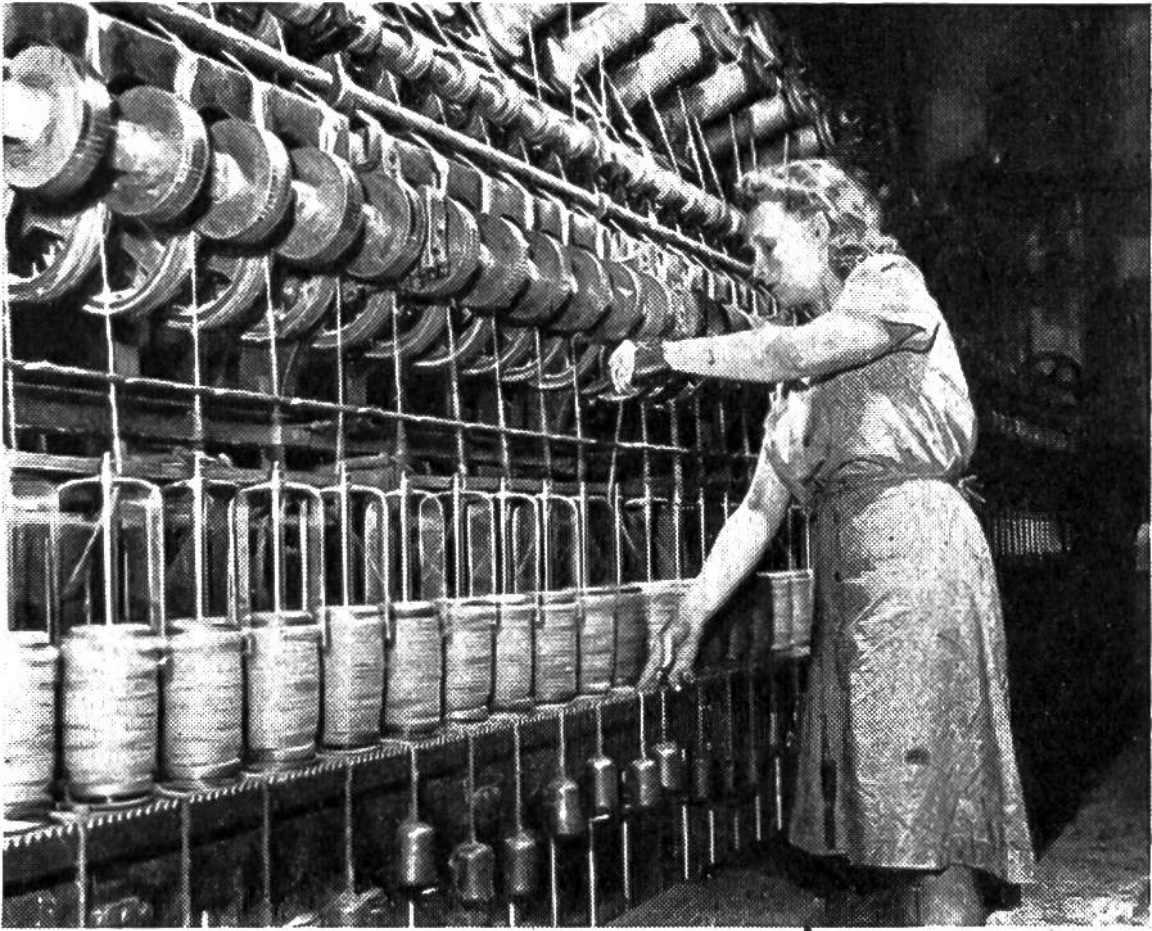
An dieser Spinnmaschine entsteht aus den losen Strähnen das als Rohmaterial für Seilerwaren dienende Garn.

meist durch Maschinen erfolgt. Nach dem Verspinnen der zähen Hanffaser stellt man daraus Stricke, Taue, Segeltuch, Säcke usw. her.