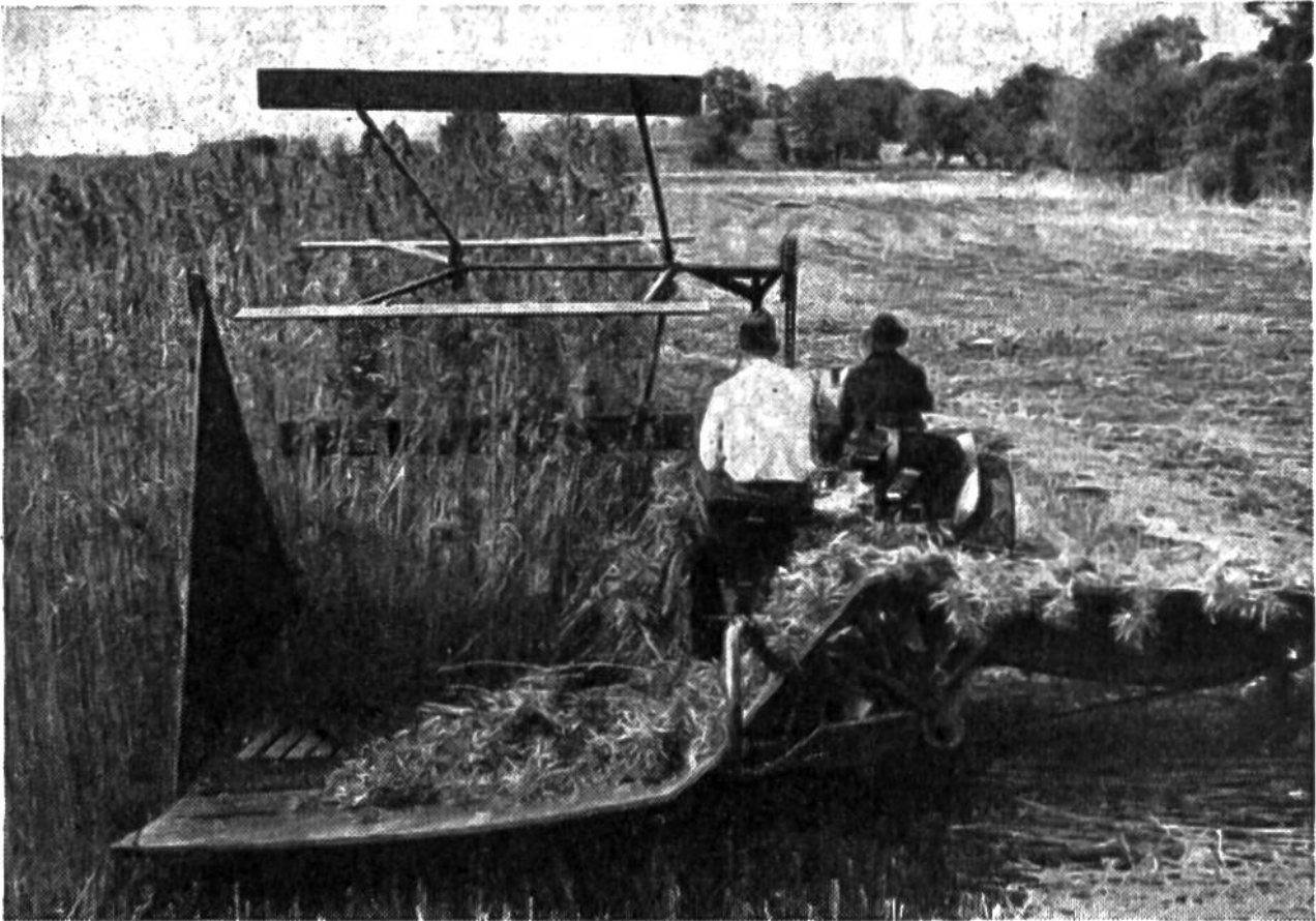
Hanfernte mit dem Getreidemäher, der die Stengel am Boden zur Tauröste ausbreitet.