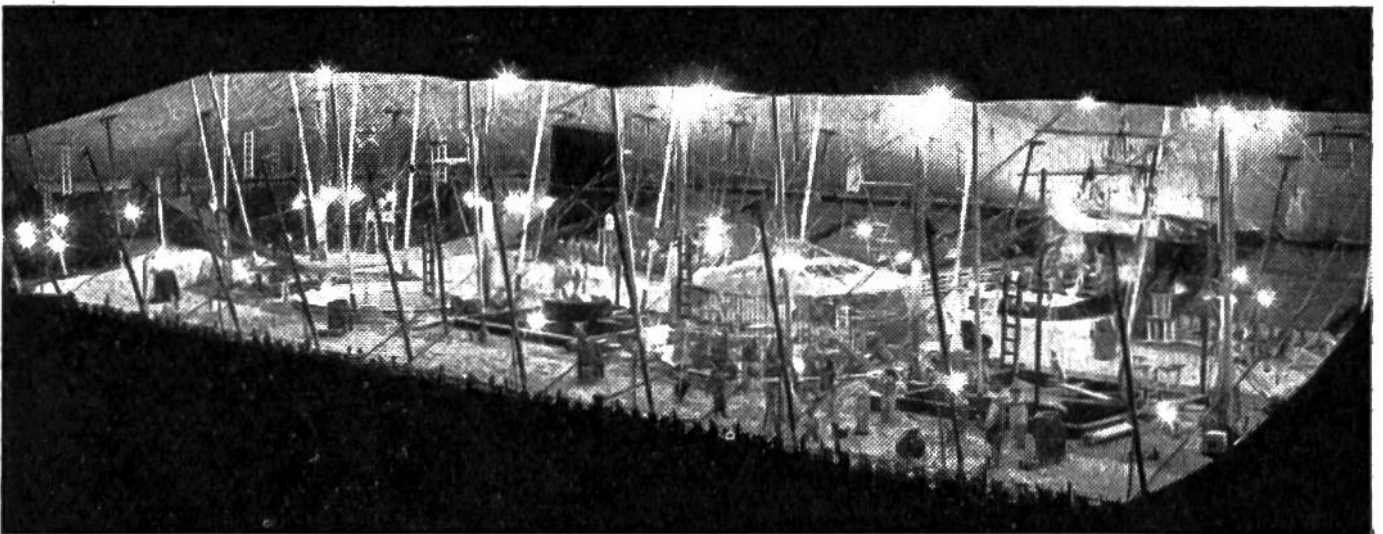
Der Spielzeug-Zirkus kann 17 000 Spielzeug-Zuschauer aufnehmen. Er weist drei Manegen (Vorführungsringe) und vier Bühnen auf.

wegs altmodisch. Am komplizierten Schaltbrett aber steht der Herr Direktor und sendet durch fast 1000 m Kabel seine