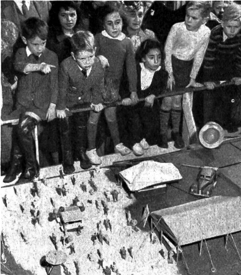
Kinder als Zuschauer hoch über dem Spielzeug-Zirkuspublikum. Die Figuren kaufen Luftballons und Zuckerstangen.

Aufstellung 32 Stunden; dabei müssen die Tiere nicht gefüttert werden, denn sie sind ja nicht lebendig! Die bunte Schau wird elektrisch betrieben, auch die aufregende Zirkusmusik. Die Löwen brüllen wie in der Wüste, so dass man sich fürchten kann, und auch die Spässe der Hanswurst kommen aus kleinsten Lautsprechern und sind keines-