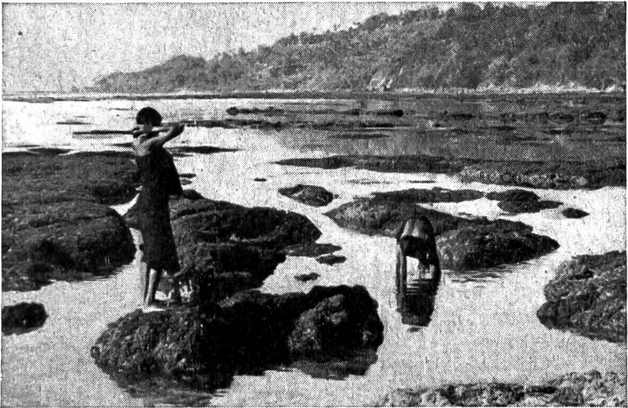
Frauen beim Sammeln von Tieren und Pflanzen auf dem Riff zur Ebbezeit. Insel Sumba.