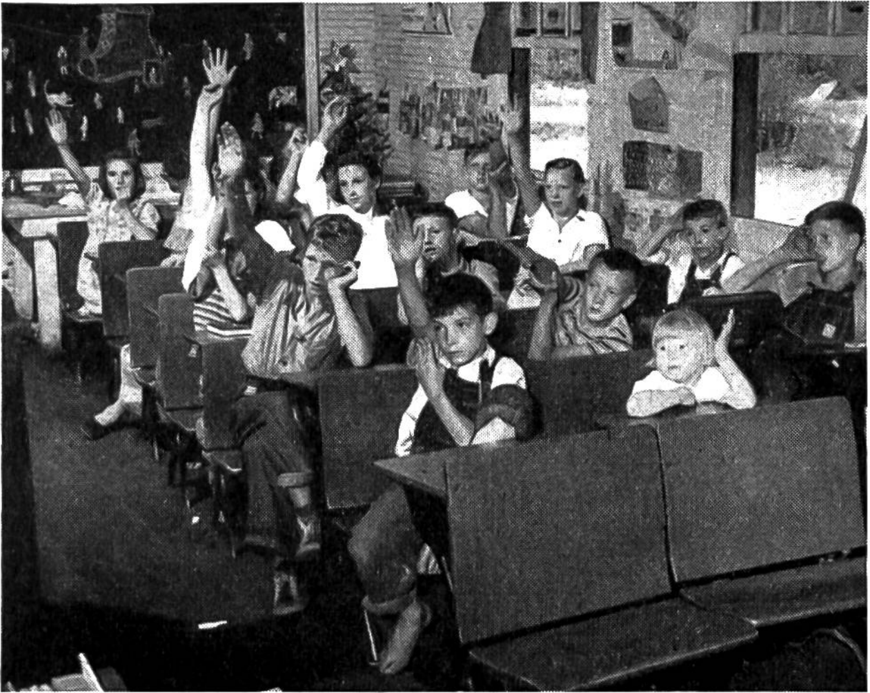
Schüler verschiedensten Alters antworten ungezwungen auf eine Frage.

vorn, so dass sie jederzeit auch schnell etwas an die Wandtafel schreiben können. Wer schriftliche Aufgaben zu machen hat, sitzt vielleicht beim Fenster, und wer Geographie studiert, nahe beim Ofen, in dessen Nähe die Landkarten angebracht sind.