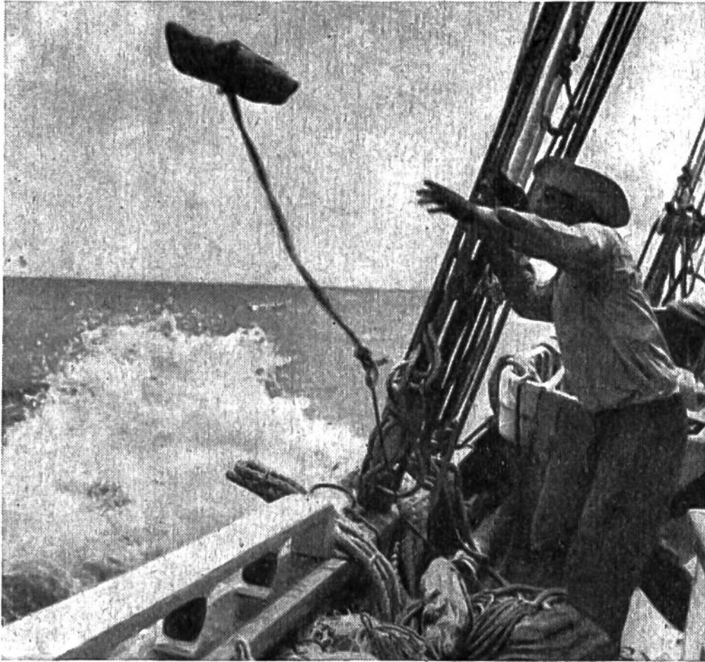
Ein verankerter Schwimmer wird zur Bezeichnung günstiger Fanggründe ausgeworfen.

Die Suppenschildkröte ist fast in allen tropischen Meeren zu Hause und kann eine erstaunliche Grösse erreichen, dazu ein Gewicht von über 100 kg. Das warme Salzwasser der Tropensee ist die eigentliche Heimat dieser urtümlichen Riesenreptilien. In diesem Element fliegen sie sozusagen mit der Eleganz eines Schmetterlings durchs Wasser: ihre flossenförmigen Beine wirken dabei wie Flügel. Tag und Nacht rudern die flachen Schildkröten durch das klare laue Wasser, grasen in den unterseeischen Seegras- und Tangwiesen, steigen dann wieder an die Oberfläche, lassen sich von den Wellen heben und senken oder hängen unbeweglich am sonnenbeschienenen, blauen Wasserspiegel. Nur zur Zeit der Eiablage treibt es die unermüdlichen Schwimmer vorübergehend ans Land. Mühsam schieben sie sich eine kurze Strecke weit auf dem flachen Küstensand landeinwärts, und plötzlich beginnen