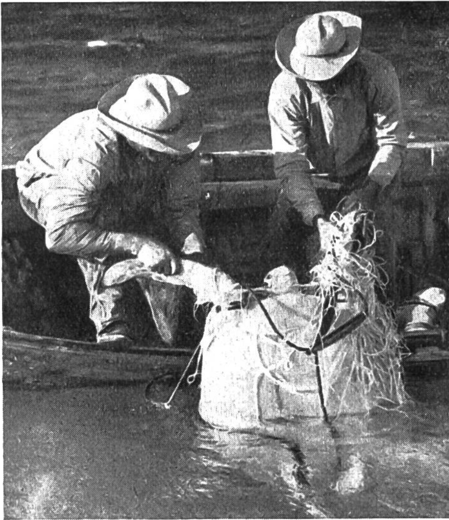
Diese Sup- penschild- kröte wiegt gegen 100 kg.

nun die Hinterflossen wie Hände zu arbeiten. Geschickt heben sie eine Vertiefung aus, indem jeder Fuss abwechselnd einsticht, eine Portion Sand fasst und mit überraschender Sicherheit nebenan ablädt. Dann kollert stundenlang der reiche Eiersegen in die Sandmulde, Hunderte von kugelrunden Eiern, und wenn das letzte den Körper der tüchtigen Legerin verlassen hat, streicht sie die Sandfläche wieder glatt, damit nichts die sich selbst überlassene Brut verrät, während die erleichterte Reptilienmutter sich wieder dem Meer zuschiebt, das sie für rund ein Jahr nicht wieder verlassen wird.