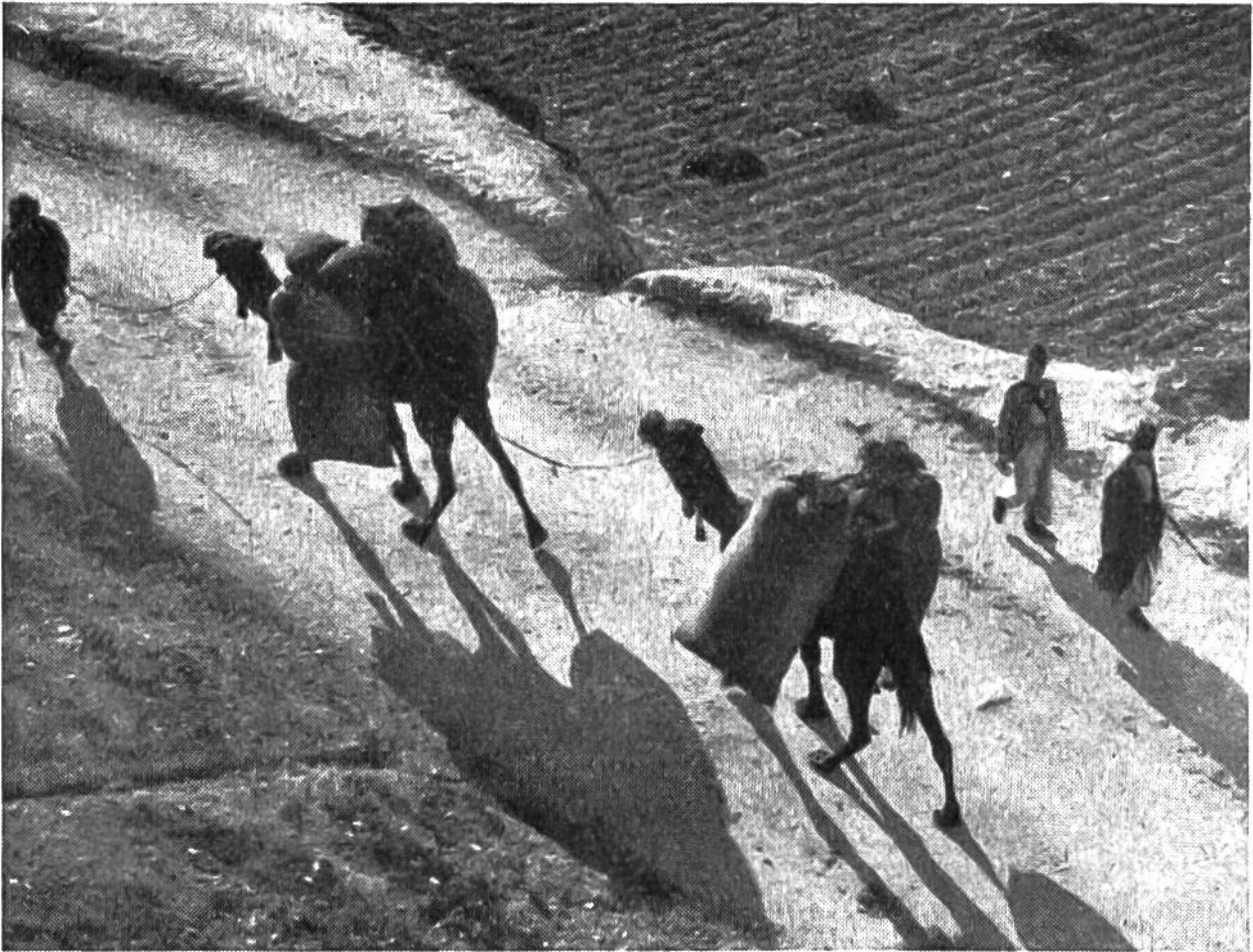
Kamele tragen die Ernte ins Dorf.

Zeitpunkt des Schnittes vor die eigentliche Vollreife gelegt, um Ausfallverluste zu vermeiden; wir breiten auch deshalb das Getreide zum Nachtrocknen auf den Feldern aus.