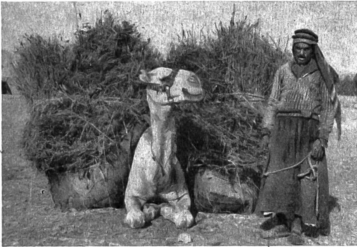
Der „Erntewagen“ der syrischen Steppe.

Büscheln und Garben, welche der Steppenboden nach mühevoller Pflanzarbeit hergibt, um die Menschen mit Brot zu versorgen. Die Felder sind mager und karg und dauernd von wucherndem Steppengras, von Moosen und Flechten bedroht, in denen das keimende Saatkorn allzu leicht erstickt. Kurzes Stroh, dünner Stand der Halme, kurzährige, stachelige Fruchtschoten – eine Art von verkümmertem Stachelweizen – versprechen keinen grossen Ertrag. Wie überall im älteren Ackerbau und in der Gewohnheit primitiver, vom Fortschritt der Technik unberührter Naturvölker, wird das Getreide bei den Arabern der syrischen Steppe in der Vollreife, d. h. wenn die Körner auf den stehenden Pflanzen völlig reif und lufttrocken geworden sind, geschnitten. Sorgfältig wird Büschel um Büschel mit der Sichel gemäht, und es bedarf wegen des leichten Ausfallens der dünnen Körner besonderer Behutsamkeit, da die Verbindung des Korns mit der Mutterpflanze nur noch ganz lose ist. – Wir in Europa wie in allen fortgeschrittenen Kulturländern schneiden das Getreide mit der Sense oder mit der rascher arbeitenden Maschine und mit dem modernen Bindemäher und haben den