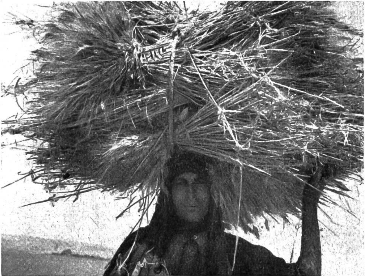
Beduinenfrau der syrischen Steppe mit einer Getreidegarbe.