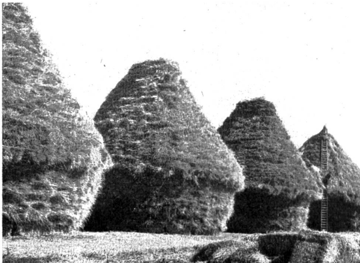
Den Negerhütten ähnlich, stehen die sorgfältig aufgeschichteten Strohhäufen auf dem fruchtbaren Neulandboden.

tätigkeit dieses alten, arbeitsamen Kulturvolkes, das sich für seine landhungrigen Bauernsöhne auf friedlichem Wege eine zwölfte Provinz zu erobern sucht, ragt als leuchtende Kultur- tat aus den Wirrnissen unserer Tage hervor. A. B.