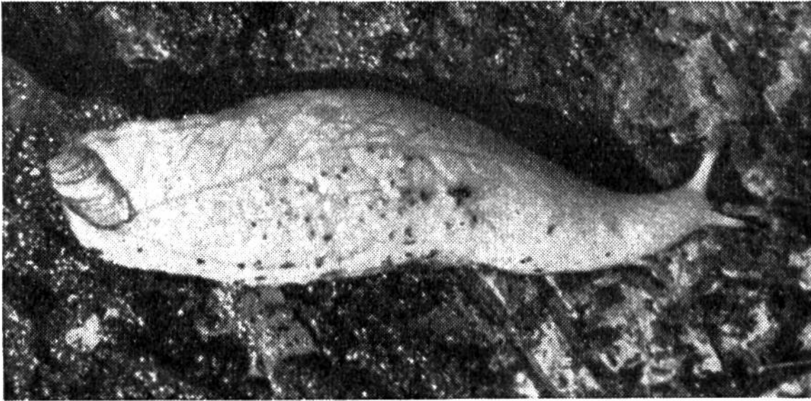
Die seltene gelbe Raubschnecke trägt am Hinterende einen winzigen Schalenrest.

bohrende Kreisbewegungen im feuchten Boden eine faust-grosse Höhle anzulegen, um in dieser schützenden Vertiefung die gegen Trockenheit empfindlichen Eilein dem Erdreich anzuvertrauen. Die Brutstelle wird aussen bis auf eine kleine Öffnung wieder so zurechtgemacht, dass niemand etwas von dem kostbaren Inhalt ahnt. Nach einigen Wochen schlüpfen die mit dünnen Schalen versehenen Schneckenkinder aus.