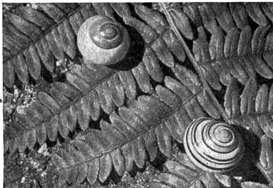
Zwei der vielen Dutzend hübschen einheimischen Schneckenarten.