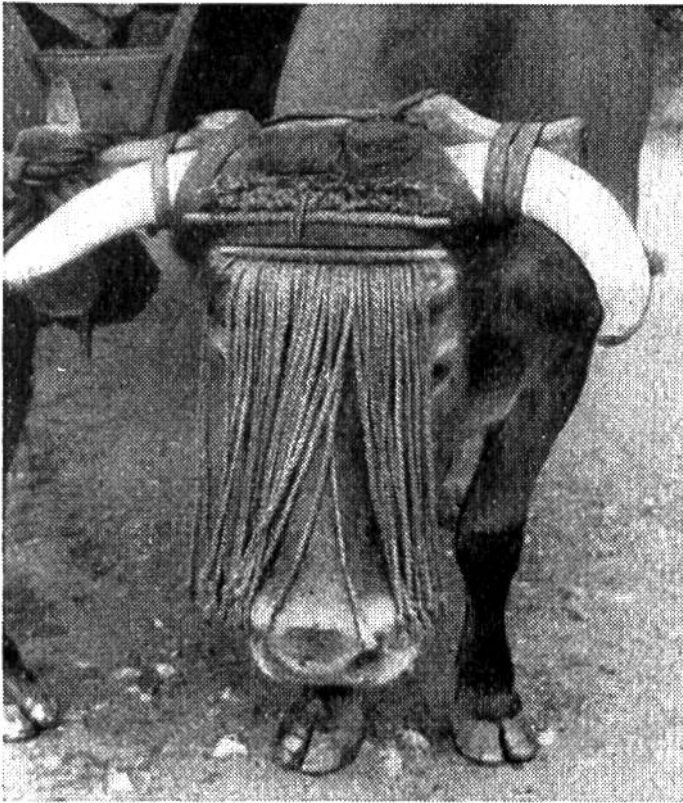
In der französischen Landschaft Lot kennt man einen sehr originellen und dazu dekorativ wirkenden Fliegenschutz.

richtige Betreuung unserer vierbeinigen und gefiederten Freunde. Wessen Verantwortungsgefühl der „stummen Kreatur“ gegenüber zu wünschen übriglässt, bei dem wird auf eine Anzeige hin unsere im allgemeinen recht tierfreundlich eingestellte Polizei zum Rechten sehen. Denn jede Tierquälerei, auch die fahrlässige, ist strafbar.