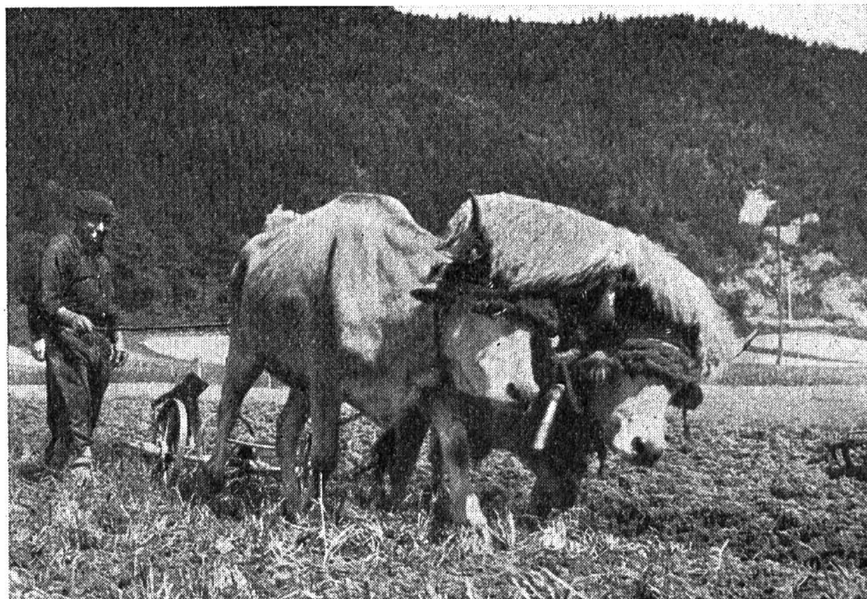
Baskische Bauern in Nordspanien breiten als Schutz gegen die Hitze ein Lammfell über die Köpfe der Zugochsen.