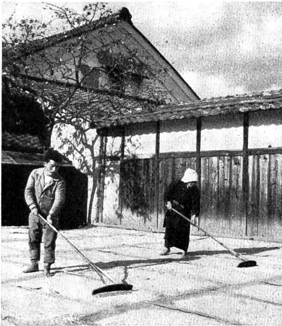
Ausbreiten von Reis zum Trocknen im Hofe eines japanischen Dorfes nahe bei Kyoto.

dem meistens mit Hilfe von Sicheln oder kleinen Messern vorgenommenen Ernten ergibt dies ein unvorstellbares Mass von Mühe. Tag für Tag und viele Wochen hindurch müssen die Reisbauern zum grössten Teil in Schlamm und Nässe hart arbeiten, um sich ihre tägliche Nahrung zu sichern. A. Bühler