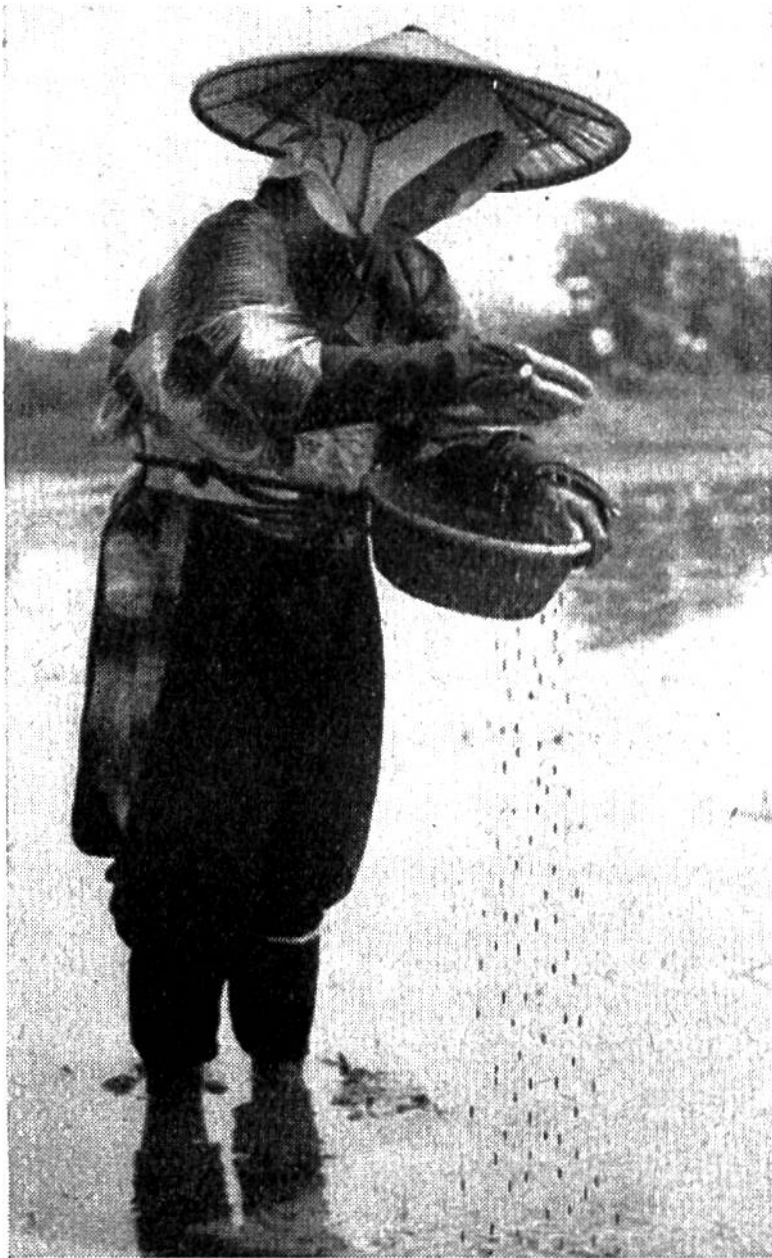
Aussäen von Reis in ein überflutetes Feld durch südjapanische Bäuerin.

steht man, dass ungeheure Mengen von Reis geerntet werden müssen, damit so gewaltige Menschenmassen genügend zu essen haben. Nach Feststellungen in den Jahren 1949/50 betrug die Welternte an Reis nahezu 151 Millionen Tonnen. Unter den verschiedenen Produktionsländern stehen China (44,5 Mill. t), Vorderindien (Indien und Pakistan, 32,3 Mill. t) und Japan (12,2 Mill. t) im Vordergrund. Erst in beträchtlichem Abstand folgen andere asiatische Staaten; Indochina (5,5 Mill. t), Siam (5,1 Mill. t), Burma (4,2 Mill. t). Noch weniger liefern Südamerika, Afrika und Nordamerika. Am Schluss steht Europa mit 1,1 Millionen Tonnen. Obwohl in den asiatischen Staaten so riesige Mengen von Reis