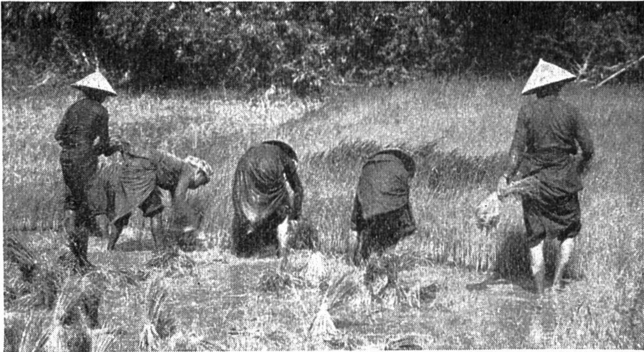
Saatbeet mit jungen Reispflanzen (Stecklingen), die ausgezogen und zum Transport nach den Reisfeldern in kleine Garben zusammengebunden werden.

Getreide auf Äckern an. Die Mehrzahl aber muss man in Feldern pflanzen, die man bis zur Blütezeit mit Wasser überfluten kann. Erst wenn die Frucht angesetzt hat, dürfen die Felder austrocknen. Darum liegen die Hauptanbaugebiete in regenreichen Zonen der warmen Länder oder in Gebieten, wo