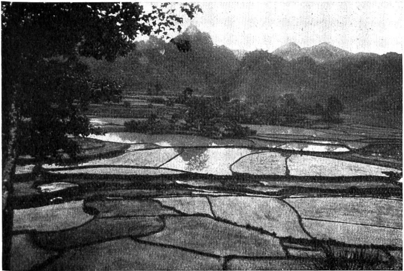
Reisfelder mit jungen Pflanzen in Tonkin, Indochina.

angebaut werden, reicht die Ernte durchaus nicht überall aus. Schon in normalen Jahren muss man in vielen, besonders dicht besiedelten Landesteilen Reis einführen, so etwa in Vorderindien, China und Indonesien (Java). Zur Katastrophe kommt es jedoch, wenn Missernten eintreten. Hungersnöte können dann nicht vermieden werden, weil die Verkehrswege nicht genügen, um rasch genug Reis in die bedrohten Gegenden zu bringen oder weil das Geld dafür fehlt. Zum Elend von unvorstellbarem Ausmasse führt es aber, wenn Kriege in den Reisgebieten wüten, die Felder verwüstet werden, die Ernte geraubt oder die Bepflanzung der Felder unmöglich gemacht wird. Darum herrscht heute in vielen Teilen von Ost- und Südostasien so bittere Not. Ungezählte Menschen sind gestorben oder am Verhungern, weil ihnen die einzige tägliche Nahrung fehlt.