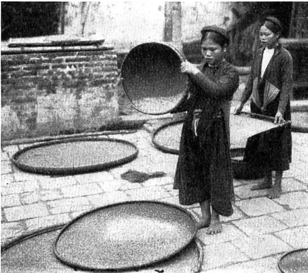
Worfeln von Reis:

bis nach der Blütezeit immer wieder besorgt werden muss, kann nur von Hand erfolgen. Zusammen mit der Vorbereitung der Felder (Pflügen, Hacken, Eggen, Ausebnen) und