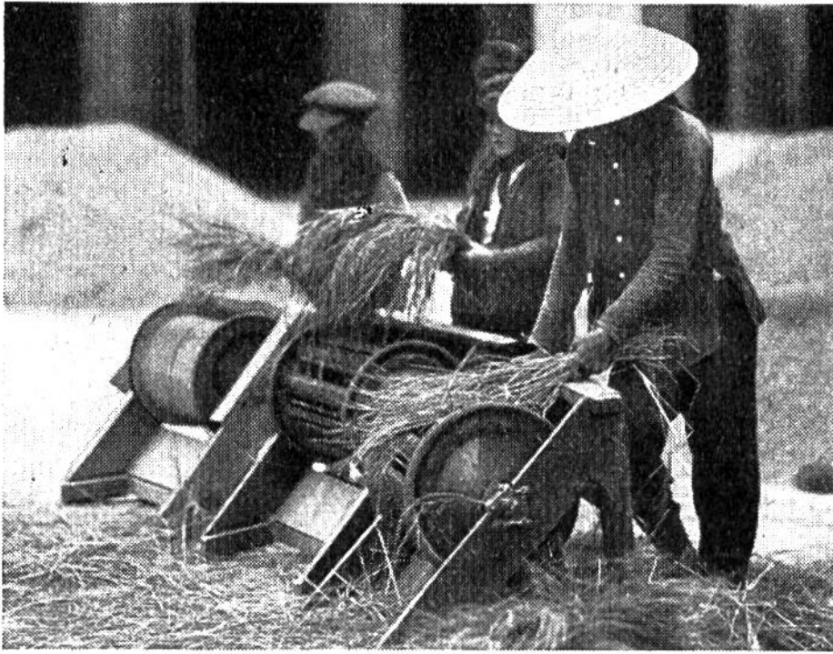
Ausschlagen von Reis (an Stelle des Dreschens) in Tonkin.

bis nach der Blütezeit immer wieder besorgt werden muss, kann nur von Hand erfolgen. Zusammen mit der Vorbereitung der Felder (Pflügen, Hacken, Eggen, Ausebnen) und