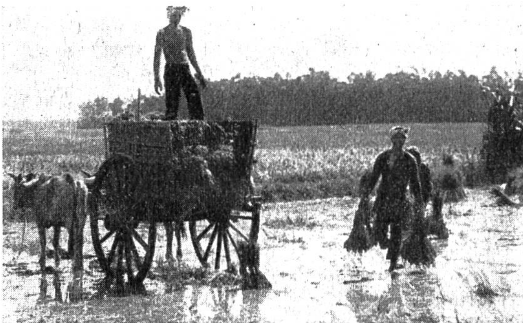
Transport junger Reispflanzen in Cochinchina.

Getreide auf Äckern an. Die Mehrzahl aber muss man in Feldern pflanzen, die man bis zur Blütezeit mit Wasser überfluten kann. Erst wenn die Frucht angesetzt hat, dürfen die Felder austrocknen. Darum liegen die Hauptanbaugebiete in regenreichen Zonen der warmen Länder oder in Gebieten, wo