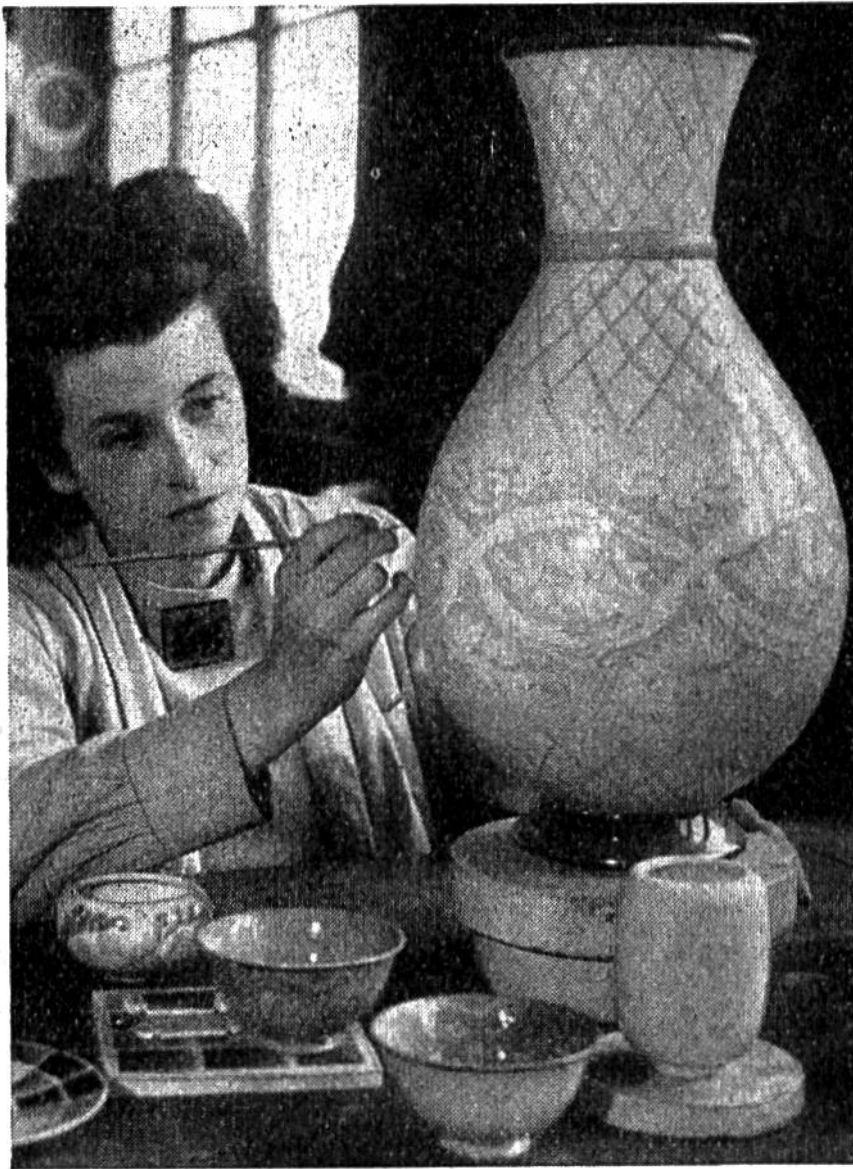
Eine Kunstgewerblerin bemalt eine Sèvres-Vase.