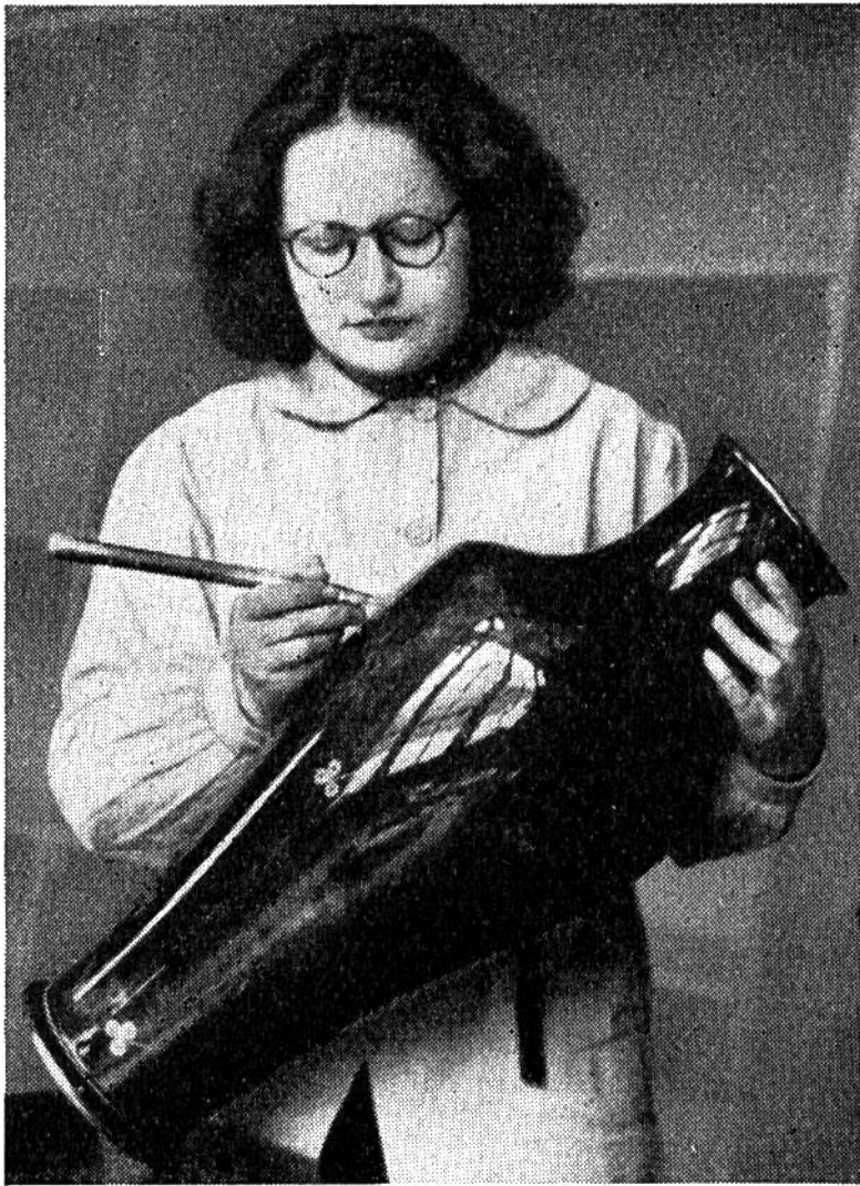
Eine junge Spezialistin poliert und glättet eine prächtige Sèvres-Vase.

und nach ihnen die bürgerlichen Regierungen bis heute die Führung der Manufaktur übernehmen.