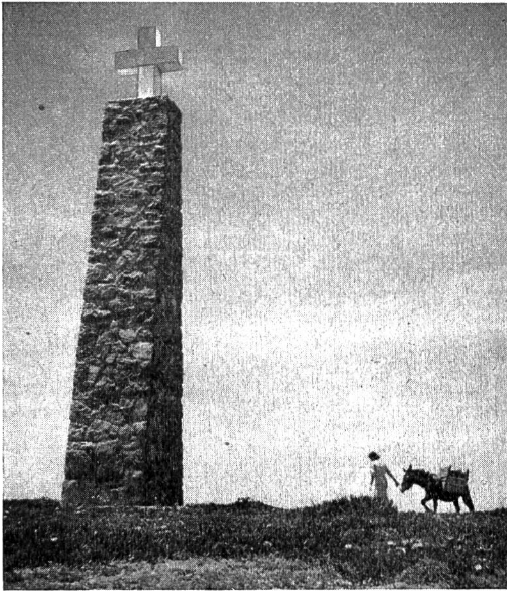
Das steinerne Wahrzeichen am westlichsten Ende unseres Festlandes.