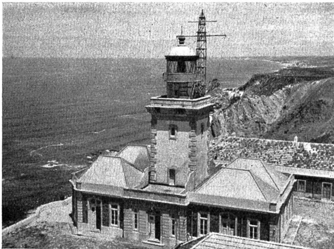
Der Leuchtturm von Cabo da Roca mit Radiostation (Hochantenne).

Auf Cabo da Roca, der kahlen Landzunge, steht ein moderner Leuchtturm. In Sturm und Nebel, die in diesen Breiten sehr häufig sind, gibt er den Seefahrern, die von den Azoren kommen, das erste sichere Zeichen von Land. Das Leuchtfeuer des Turmes ist so stark, dass es aus der Entfernung von 72 Kilometern draussen auf dem Meer gesehen werden kann. Ein eigens zu diesem Zweck an Ort und Stelle erbautes Kraftwerk speist eine 3000 Watt starke Glühbirne, die von Vergrößerungsspiegeln umgeben ist. Sie wirft ihr Licht durch diese riesigen Vergrößerungsgläser hinaus in die Weite des Meeres.