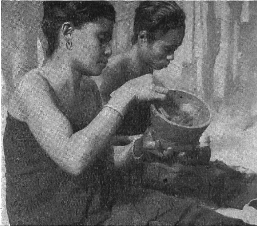
Töpferinnen von Ost-Sumba.