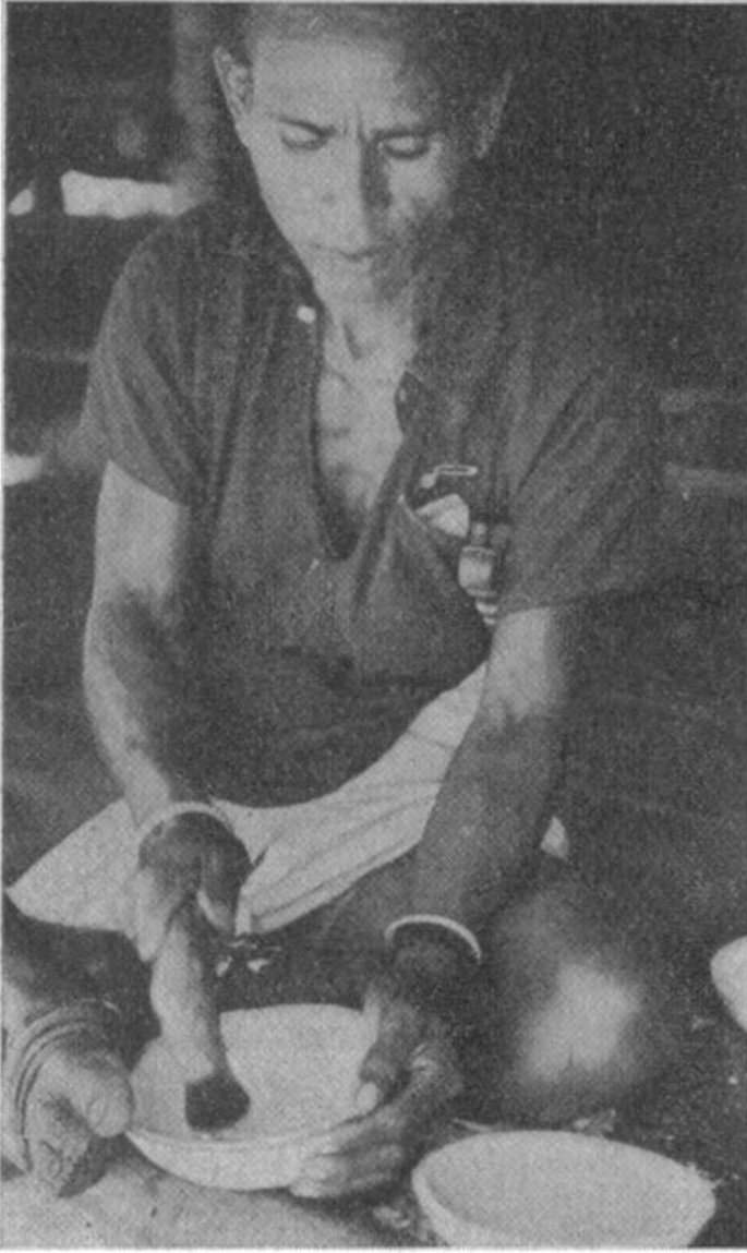
Holzschnitzer bei der Herstellung einer Schüssel. West-Sumba.

Werkzeuge der Männer von Sumba zur Herstellung von Holzschalen. Mit dem schweren Buschmesser wird ein Holzklötzchen aussen zugeschnitten, wobei das Messer je nach Bedarf zum Schlagen oder zum Schneiden verwendet wird. Zum Aushöhlen braucht man einen Dächsel, der wie eine kleine Hacke mit scharfer Eisenklinge aussieht. Mit einem Schabeisen, dessen Klinge seitwärts umgebogen ist, glättet man das Innere. Raspeln aus der Haut von Rochen, die wie eine Feile feine, vorstehende Zähne besitzen, dienen zum Polieren des Holzes.