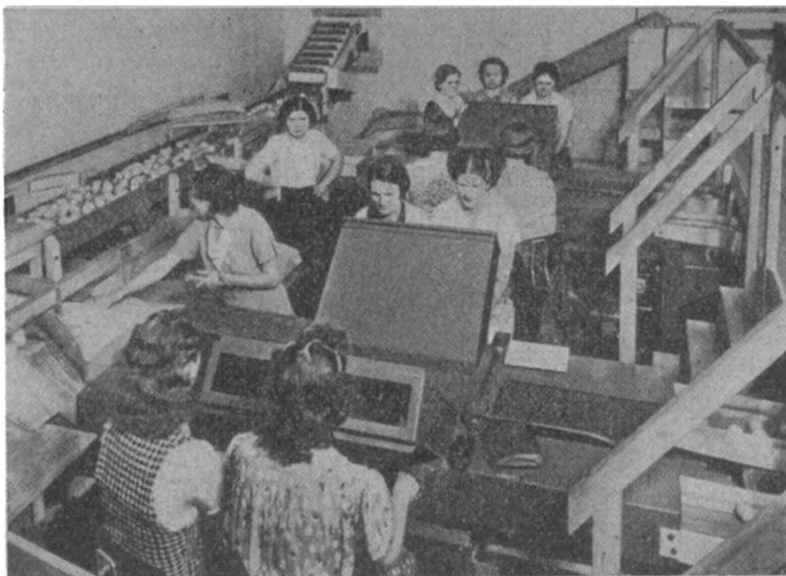
Röntgenstrahlen im Dienste der Lebensmittelprüfung. Kalifornische Orangen werden vor der Verarbeitung auf dem Laufband durchleuchtet und nicht einwandfreie Früchte ausgeschieden.