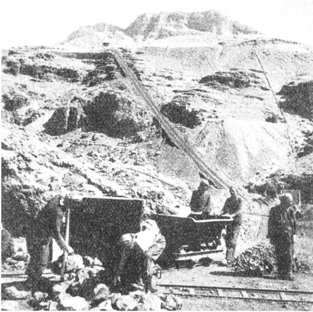
Ausbeutung eines marokkanischen Phosphatlagers.