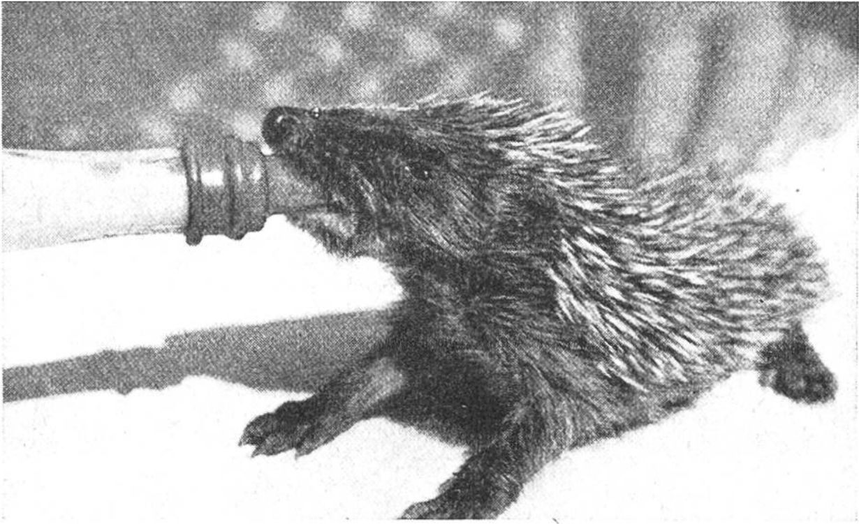
Bei diesem Igelkind sind die Stacheln bereits stark gewachsen.

achter durch laute Fressgeräusche zu erkennen, wenn sie einen fetten Bissen oder die kleine Schale mit Milchbrocken gefunden haben, die ihnen ein Tierfreund allabendlich anbietet. – Leider ist die irrtümliche Ansicht weit verbreitet, dass Igel hervorragende Mäusejäger seien. Es kommt daher oft vor, dass man einen im Freien gefundenen Igel kurzerhand in ein Magazin oder in einen Keller sperrt, wo er „mausen“ soll. Gerade das kann er aber nicht und muss daher nach kurzer Zeit elend zugrundegehen. Nur ausnahmsweise und unter besonders günstigen Bedingungen wird der Igel einmal eine Maus erwischen; aber er kann gewiss nicht vom Mäusefang leben.