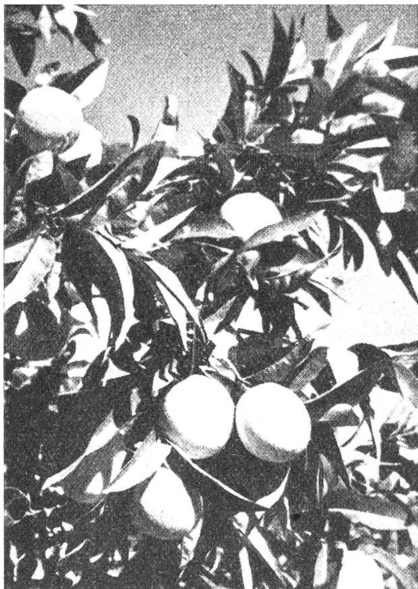
Erntereife Orangen in Nordafrika.