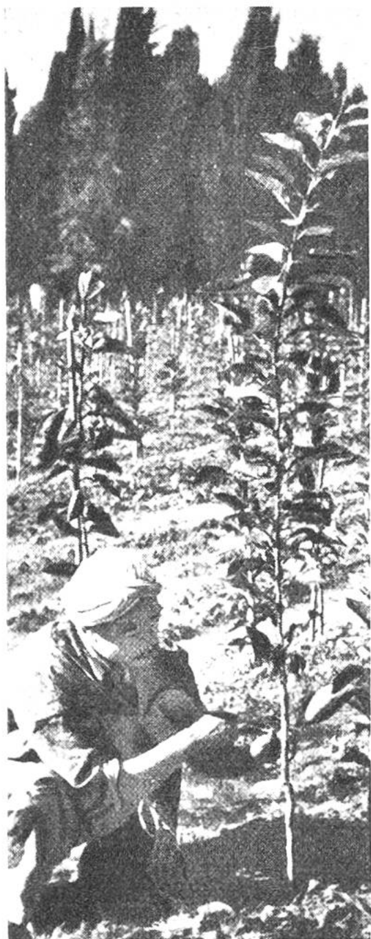
Veredelung junger Orangenbäumchen in einem nordafrikanischen Kolonialbetrieb.

Die zur Familie der Rautengewächse gehörenden Citrussträucher sind mit immergrünen Blättern, wohlriechenden Blüten von weisser bis rötlicher Farbe und runden oder länglichen, nuss- bis kopfgrossen Beerenfrüchten behangen. Die Fruchtschale ist reich an mit ätherischem Öl gefüllten Drüsen. Unter der Schale liegt eine weissliche, schwammige Schicht, welche die keilförmigen, saftreichen „Schnitze“, in denen wenige Samen sitzen, umhüllt.