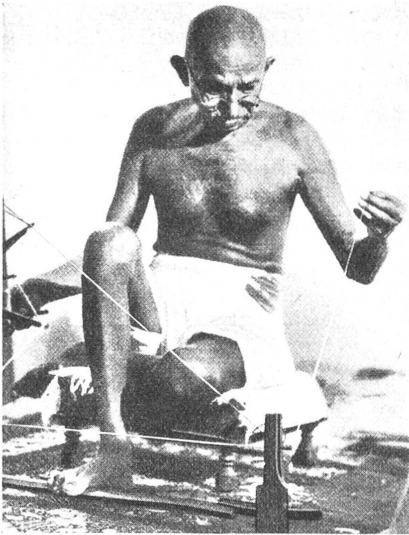
Gandhi am Spinnrad. Mit der Einführung des häuslichen Spinnens verschaffte er zahllosen Familien Verdienst.

dischen Volks- epos Mahabara- ta, wie auch die Bergpredigt ken- nen, die einen ge- waltigen Ein- druck auf ihn ausübte. Nach seiner Rückkehr nach Indien wur- de er Fürsprech in Rajkot und in Bombay.