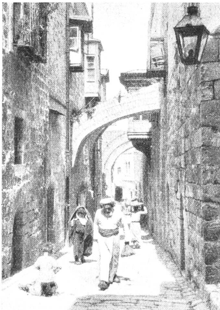
Der „Heilige Weg“ (Via Dolorosa) in Jerusalem.

Industrie, Gewerbe und Handel haben noch gewaltige Nacharbeit zu leisten, um den Wohlstand anderer Mittelmeerländer gleicher oder ähnlicher Naturbedingungen zu erreichen. Aus dem Toten Meer sind Kali und Brom zu holen, die Zement- und Baumaterialienindustrie steht in verheissungsvollen Anfängen. Eisenbahnlinien und moderne Strassen durchziehen bereits das Land. Es wird der Einsicht und der Vernunft der Leiter des neuen Staates sowie der Führer der arabischen Bevölkerung anheimgegeben sein, ob sich das Land friedlich entwickle. Gerade in der gegenseitigen Duldung und Verträglichkeit werden sich die am Werk befindlichen staatsgründenden