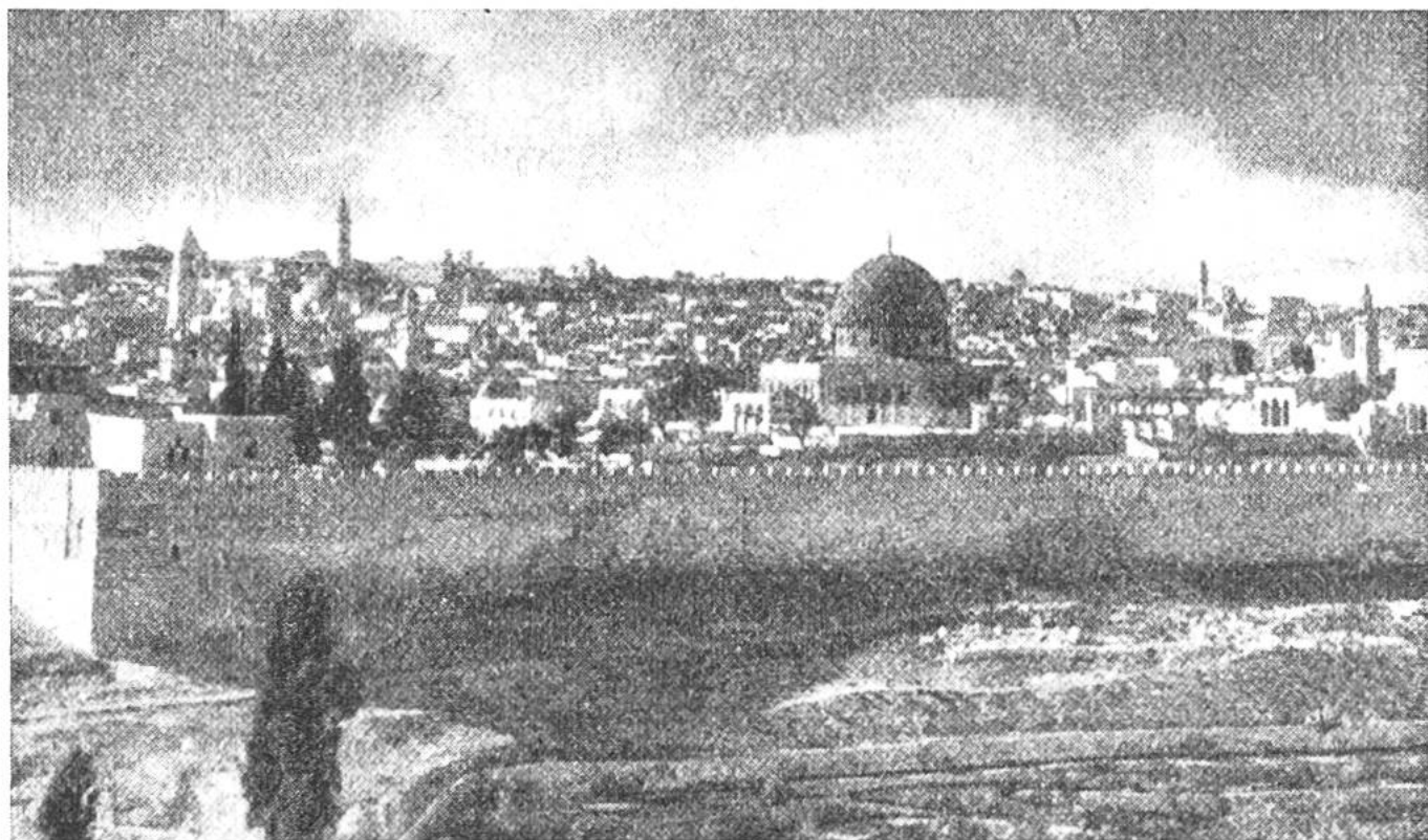
Blick auf Jerusalem, die Hauptstadt Palästinas.