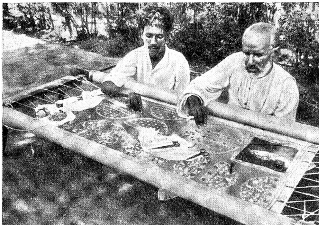
Dies ist eine „Fabrik“ für den Export der in aller Welt bewunderten und begehrten indischen Stickereien.

Die schönen Batiktücher etwa werden von den eingeborenen Frauen mit Hingabe und Kunstsinn von Hand gewoben, bedruckt oder mit Farben bemalt, die ihrerseits wieder aus Wurzeln, Rinde, Blättern, Früchten oder Blüten gewonnen werden. In der Hauptsache werden schwarze, rote, braune und gelbe Farben in harmonischer Tönung und in geometrischen Figuren zusammengestimmt. Die Zeichenkunst ist daher als Voraussetzung solcher Malkunst von altersher bei den primitivsten Völkerschaften des Ostens erstaunlich entwickelt.