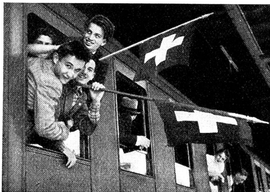
Voll froher Erwartung fahren die jungen Schweizer in ihre Auslandsferien.

Ferien im Ausland sind nicht nur zur weiteren Ausbildung der Sprachkenntnisse äusserst wertvoll, sondern dienen, wie der Internationale Briefwechsel, dem Gedankenaustausch über