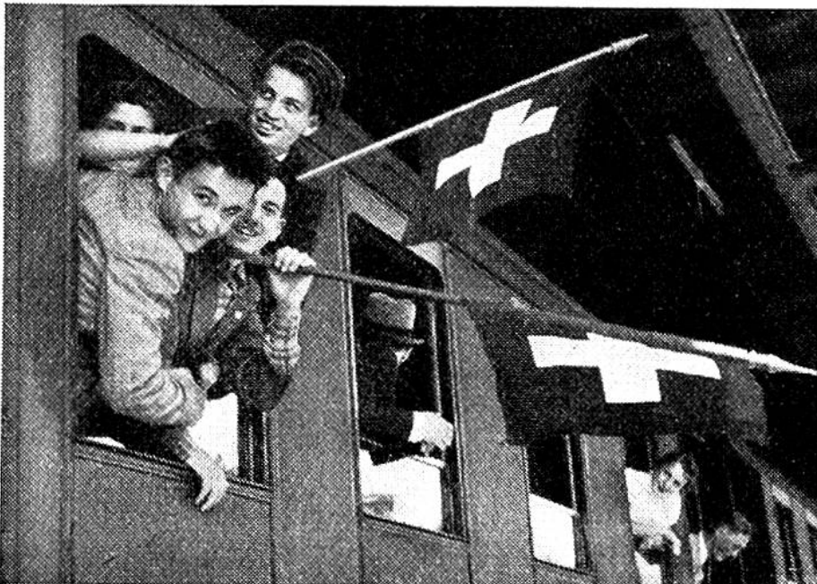
Voll froher Erwartung fahren die jungen Schweizer in ihre Auslandsferien.

Ferien im Ausland sind nicht nur zur weiteren Ausbildung der Sprachkenntnisse äusserst wertvoll, sondern dienen, wie der Internationale Briefwechsel, dem Gedankenaustausch über