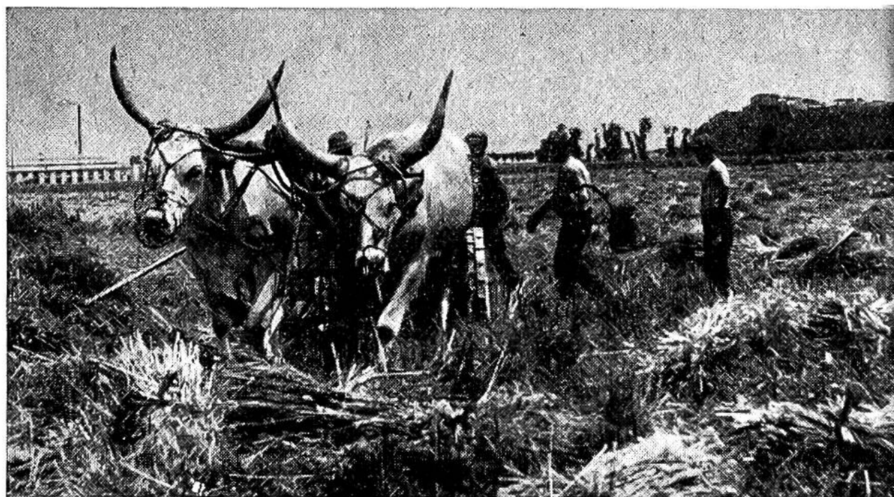
Reisernte in Italien. Die mächtigen Ochsen der Romagnola-Rasse ziehen einen modernen Bindemäher.

In der Lombardei erntet man den Reis, wie bei uns das Getreide, mit der Sense oder mit dem Bindemäher im Nachsommer. Auch das Trocknen, Einführen, Aufstocken und Dreschen unterscheiden sich nur wenig von der Behandlung unseres Brotgetreides.