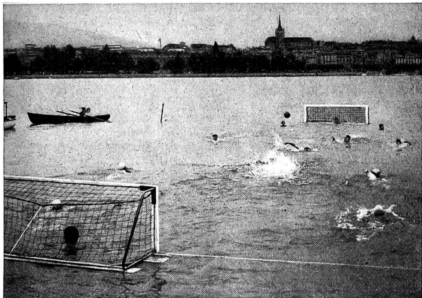
Wasserballspiel in Genf. Anschwimmen der Spieler.

mann und einer Torwächter. Die eine Mannschaft trägt blaue, die andere weisse Mützen. Die Torwächter erhalten besonders gekennzeichnete Mützen.