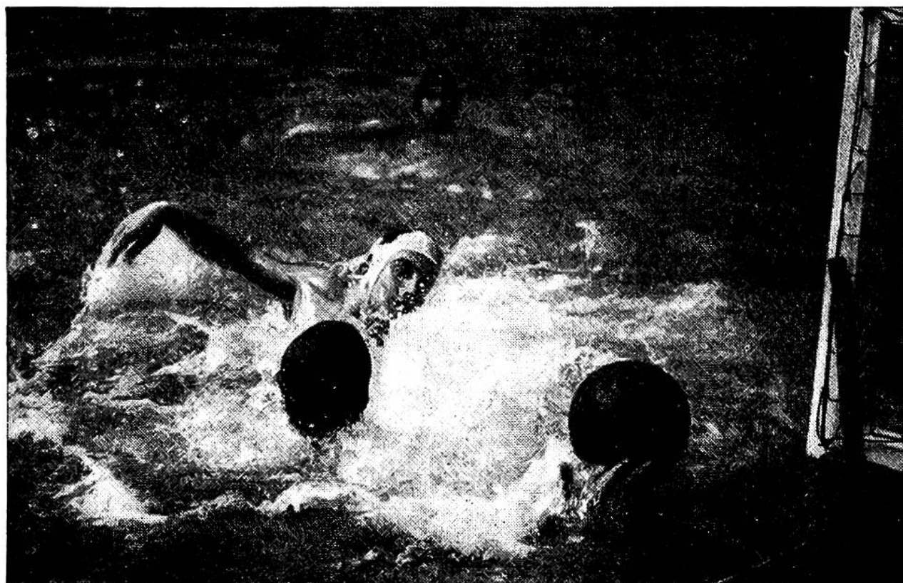
Der Verteidiger kann den Ball noch rechtzeitig vor dem Stürmer mit weisser Mütze aus gefährlicher Tornähe ins Spielfeld zurückwerfen.

terbrechungen müssen die Spieler auf dem Platze verbleiben, bis der Ball die Hand des werfenden Spielers verlässt.