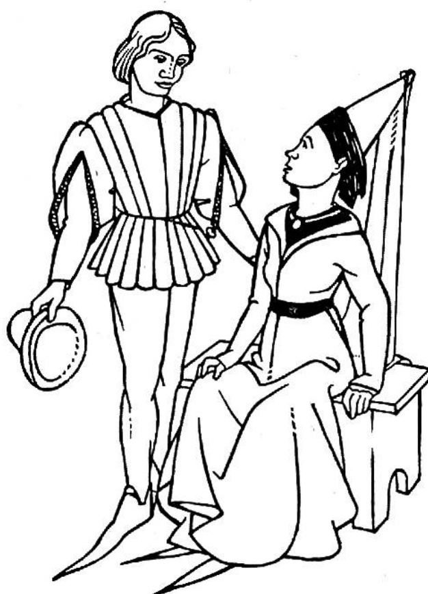
Burgundische Mode, 1470.