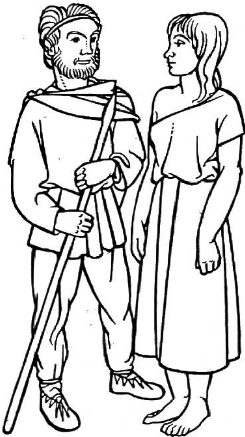
Kleidung der Germanen zur Römer- zeit, 2. Jahrhundert n. Chr.