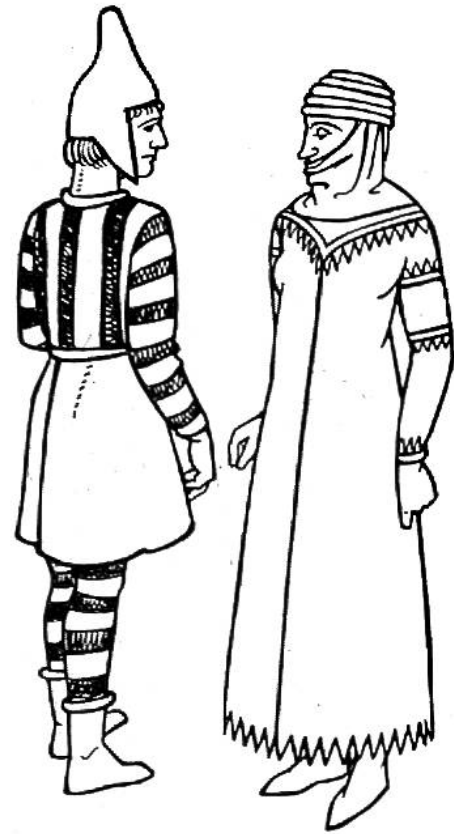
Tracht der Perser um 600 v. Chr.