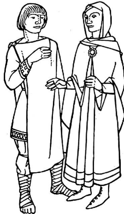
Tracht der Franken zur merowingisch- karolingischen Zeit, 7.–9. Jahrhundert.