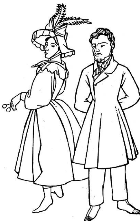
Mode von 1832.