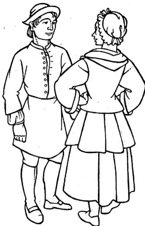
Volkstracht um 1760.