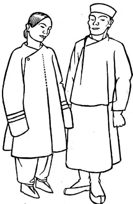
Kleidung der Chinesen, 19. Jahrhundert.