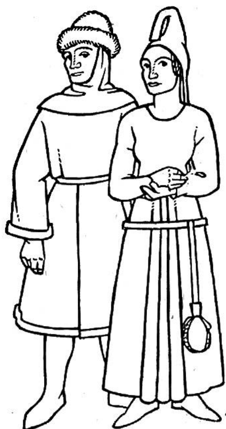
Kleidung der Normannen im 13. und 14. Jahrhundert.