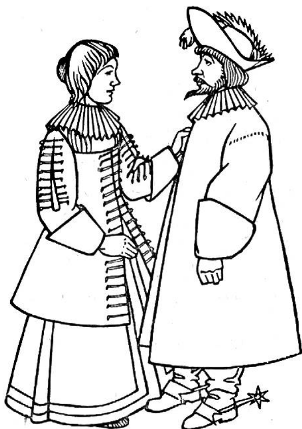
„Alla modo“-Tracht zur Zeit des Dreissigjährigen Kriegs, um 1630.