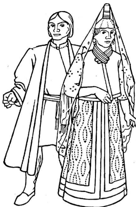
Tracht der Bojaren (russische Adlige) um 1600.