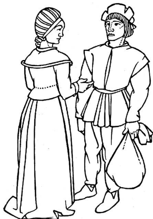
Kleidung der Bürgersleute zur Reformationszeit, nach 1500.