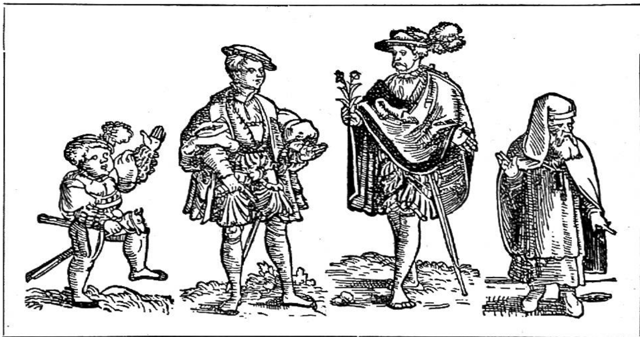
Die vier Lebensalter. (16. Jahrhundert.)