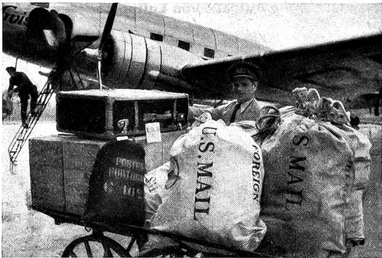
Ausladen von Postsäcken und Stückgütern aus einem „Swissair“-Verkehrsflugzeug.

tiative ist unsere Postverwaltung diesem Grundsatz bis auf den heutigen Tag treu geblieben. Sie hat unserer Luftfahrt unschätzbare Dienste erwiesen und schuf ihr eines der soliden Fundamente, auf denen sich unsere Aviatik kräftig entwickeln konnte. ... Mit schönen Marken und interessanten Stempeln wurden Hunderttausende von Markensammlern für die Sache der Luftfahrt angeregt und im Laufe der Jahre als Anhänger gewonnen. Millionen von Franken hat die Post der finanziell stets bedrängten Aviatik zugeführt. Einige der fliegerischen Grosstaten des Landes, insbesondere die Auslandsflüge von Walter Mittelholzer, die „Landflüge“ der Swissair usw. waren ausschliesslich durch die Flugpost ermöglicht worden, dazu noch viele bedeutende Flugveranstaltungen. Auch die nationale Stiftung „Pro Aero“ wäre ohne die Post nie zu ihrer heutigen Bedeutung und segensreichen Aktivität herangewachsen. Der Luftverkehr ist ohne Luftpost und der daraus entfliessenden Geldmittel undenkbar. Die Post hat unsere Aviatik grossgezogen.“