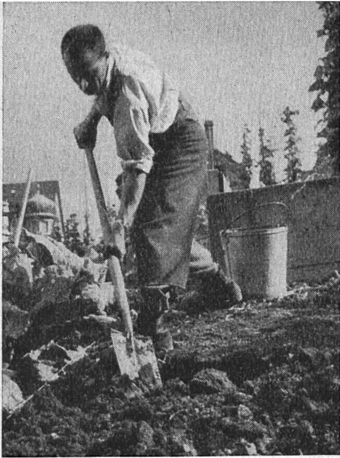
Bodenlockerung durch Umstechen mit dem Spaten.

Lebewesen und machen deren Stoffe als Nahrung für die Kulturpflanzen aufnehmbar.