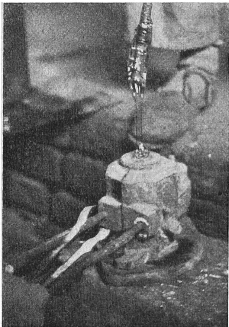
Das flüssige Glas wird vom erhöht stehenden Glasbläser in eine Form geblasen. Ein anderer Arbeiter hält die Form geschlossen.

Die mittelalterlichen Glasbläser verfertigten Flaschen, Gläser und Humpen für den Hausgebrauch sowie Retorten für die Alchimie. Berühmt sind die böhmischen und venezianischen (Murano-) Gläser aus dem 16. und 17. Jahrhundert; in diesem Jahrhundert begann auch bereits die fabrikmässige Herstellung von Glas.