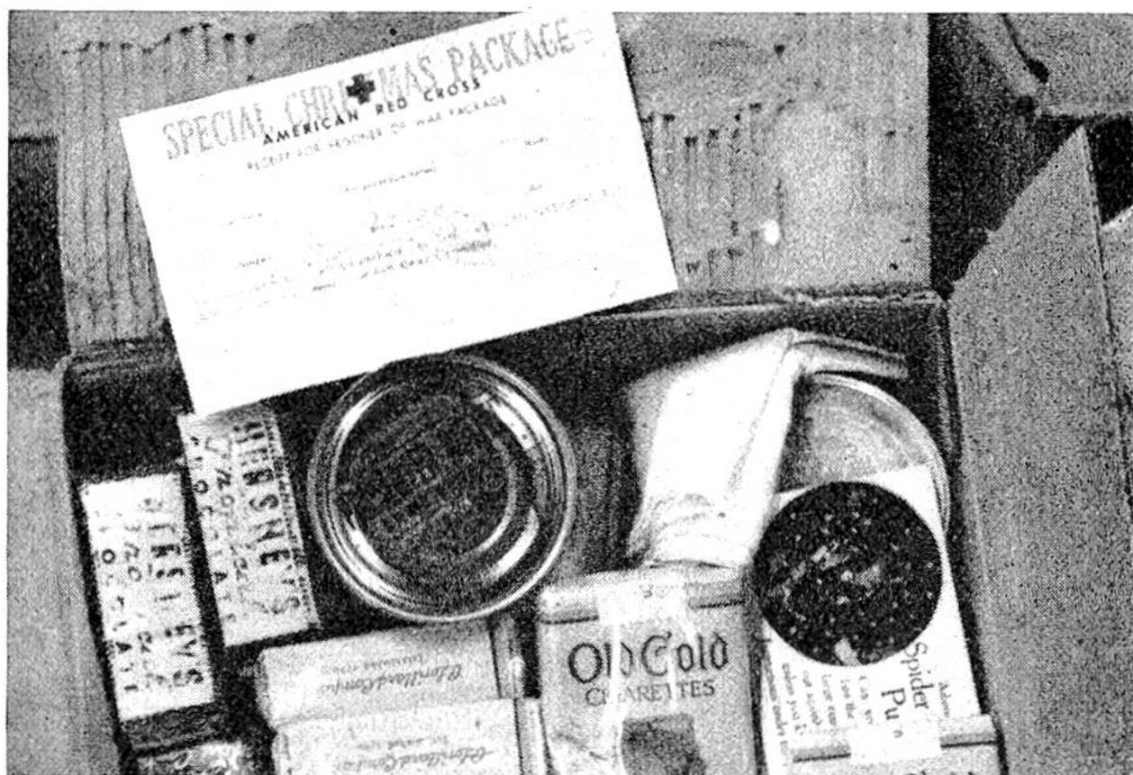
Jeder Kriegsgefangene amerikanischer Nationalität erhielt zu Weihnachten 1943 ein solches Liebesgabenpaket.

bol der friedlichen Schweiz! Sind die Liebesgaben endlich in unserem Land eingetroffen, so erfolgt von hier aus der Versand nach den Bestimmungsorten. Um den Wünschen der Kriegsgefangenenlager regelmässig entsprechen und beim Stocken der ausländischen Zufuhren die Lieferungen aufrechterhalten zu können, werden in den Zollfreilagern von Genf, Vernier, Basel, Vallorbe, Biel, Aarau und Zürich die Liebesgaben, welche der Abteilung für Hilfsaktion des Roten Kreuzes anvertraut sind, aufgestapelt. Der Inhalt von über 5000 Eisenbahnwagen zu 10 t, also ca. 50000 t sind in diesen Lagern bereitgestellt; täglich werden ca. 30 Eisenbahnwagen benötigt, um die Ein- und Ausgänge der Lagerbestände zu transportieren. — Welche Freude bedeutet es für die Gefangenen, wenn sie Bücher in der eigenen Sprache erhalten oder Konservenbüchsen mit einem Lieblingsgericht, das es eben nur zu Hause gibt, entgegennehmen dürfen. Hunderttausende von Kriegsgefangenen empfangen so in ihrer traurigen und schicksalsschweren Lage durch die Vermittlung des Roten Kreuzes ein Zeichen aus der fernen Heimat.