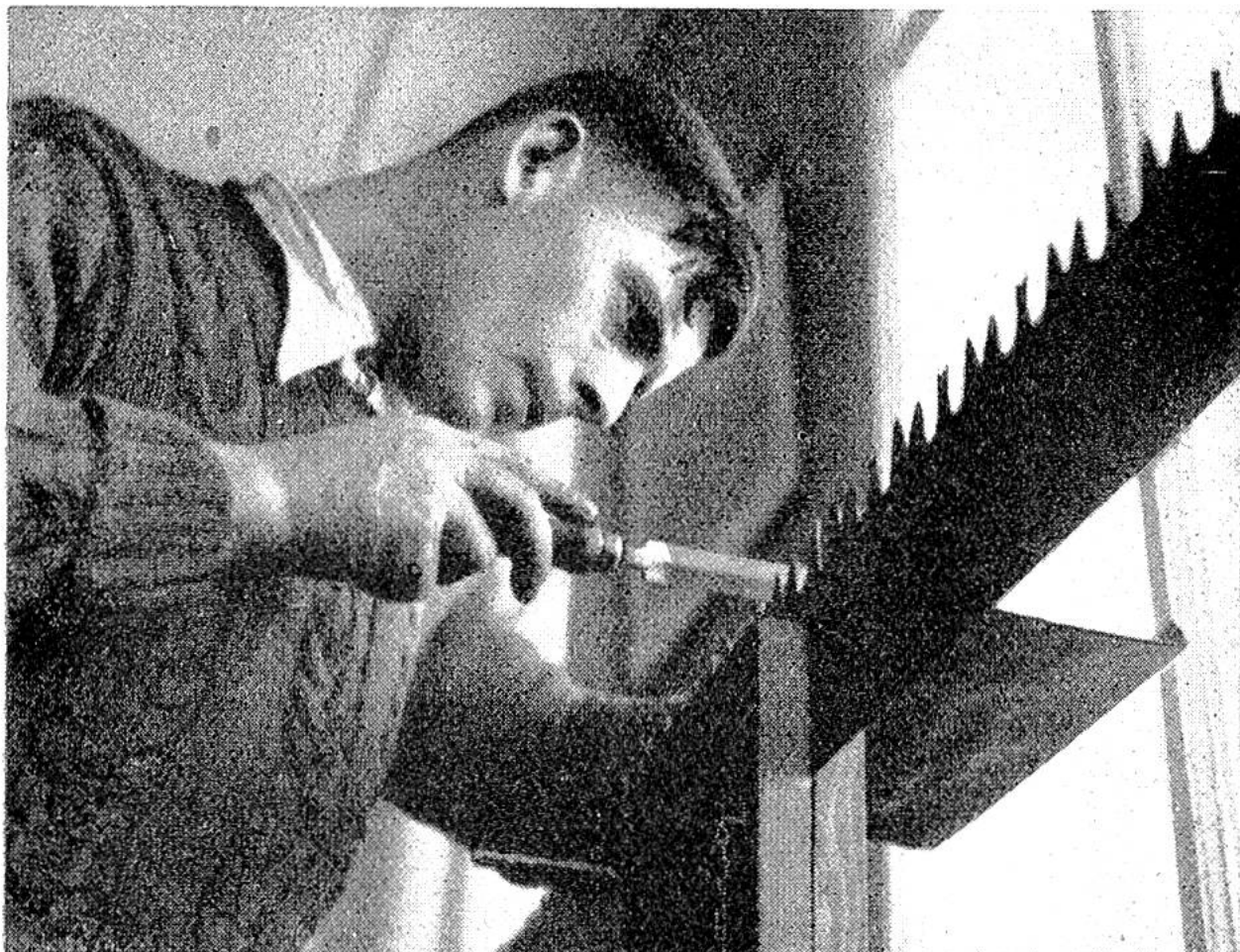
Das Feilen einer Hobelzahnsäge will verstanden sein.

nähe auch der Gesundheits- und Schönheitswert im Vordergrund des öffentlichen Interesses. Die Holznutzung kommt im Schutzwald erst in zweiter Linie und untersteht der strengen Kontrolle durch die sorgfältig geschulten zuständigen Forstorgane.